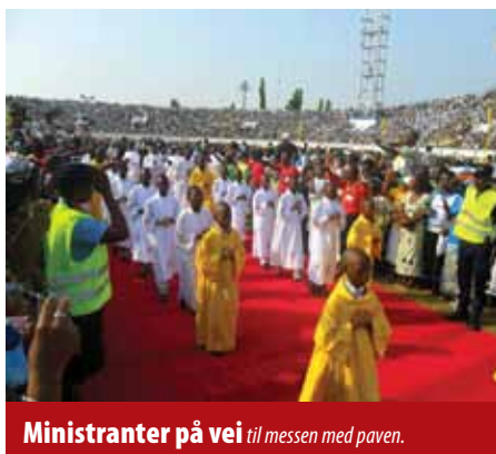
Ministrarer på vei til messen med paven.

Det vestafrikanske landet har rundt ni millioner innbyggere og grenser til Togo, Nigeria, Niger og Burkina Faso. Benins katolske befolkning teller ca. to millioner; totalt er rundt 45 % av befolkningen kristne, inntil 30 % praktiserer såkalt Vodoun (bedre kjent i Vesten under navnet Voodoo), et trossystem offisielt anerkjent av landets myndigheter, mens rundt 25 % av befolkningen er muslimer.