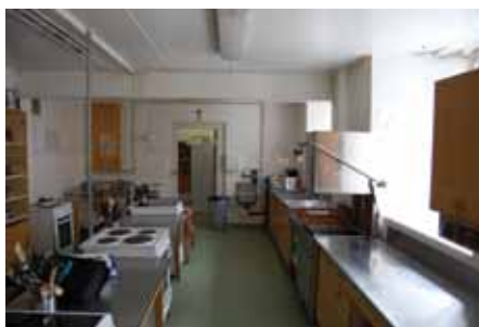
Mat og helserommet før oppussingen.