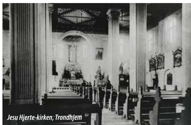
Jesu Hjerterkirken, Trondhjem

Den sterke ekspansjon i Fallizes første femten år hadde ikke vært mulig uten støtte fra utlandet. Opprettholdelsen av det store antall sogn og skoler i forhold til antallet troende var også betinget av utenlandsk hjelp. Derfra kom de fleste prester og søstre og det meste av pengene. Den første verdenskrig rammet vikariatet hardt; hjelpen fra utlandet uteble. I august 1914 bad biskopen prestene innskrenke både sognenes og egne utgifter til det absolutt nødvendige. Alt av vedlikehold som kunne utsettes, skulle utsettes. Prestene, de fleste av dem fra krigførende land, ble