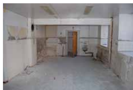
Mat og helserom under oppussingen.