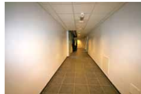
Kjellerkoridoren inn til garderobene

– Vi legger inn ny belysning og ventilasjon i alle rom. Samtidig oppgraderes det elektriske anlegget vårt, og nye datakabler strekkes. Det skjer også en opprustning av brannsikkerheten ved skolen. Skolen vil også bli oppgradert til å være tilgjengelig for funksjonshemmede. Ellers blir det bygget mange nye toaletter inne i skolen, og alle gamle toaletter fornyes. Vi har også fått nye garderober med dusjer i forbindelse med gymsalen vår. Skolen har fått et nytt mat- og helserom og en egen kunst- og håndverksavdeling med