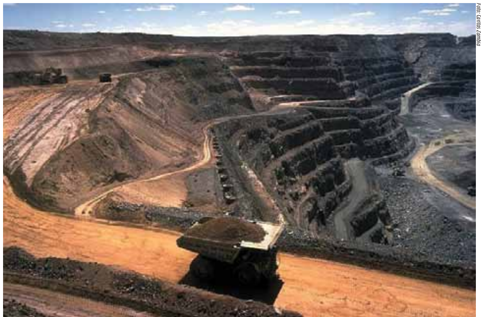
Gruvedrift i Zambia

Da landet ble selvstendig, var økonomien god. På 70-tallet sank kobberprisene, det ble tatt opp store lån, og landets økonomi begynte å skranke. Det kostet for mye for Zambia å transportere metallet ut til sine kunder i forhold til hva de fikk solgt