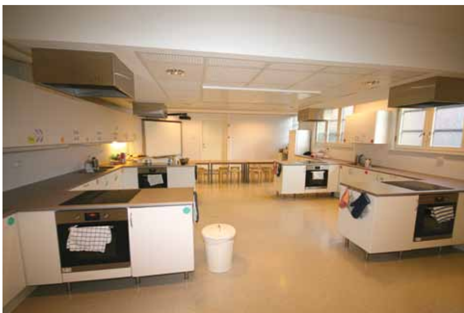
Mat og helserommet etter oppussing

Elever, foreldre, lærere og venner av skolen protesterte offentlig mot forskjellsbehandling av privatskoler, og positiv medieoppmerksomhet samt intenst arbeid fra skolens ledelse og styre fulgte. Resultatet ble at kommunen allikevel gir skolen rentekompensasjon tilsvarende Husbankens regler, og stiller med kommunal garanti slik at lånebetingelsene blir gunstigere.