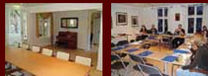
Ideelle møtelokaler for mindre grupper.