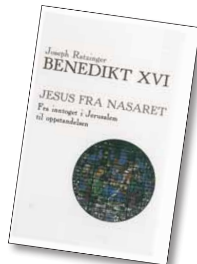
Avenir forlag 2011. Kr 378,-

For det andre, fortolkningen av Jesu person og virke støter på et annet problem: Mye som var kjent i Jesu samtid, er ukjent for mange i Vesten i dag. Jeg tenker f.eks. på forståelsen av Guds nærvær i tempelet i Jerusalem, tempelkulten, hellighet, Loven og messiasforventninger. Rådende «neo-markionitiske» tendenser (der man ser bort fra Det gamle testamente og utelukkende tolker Kristus-begivenheten som et brudd med Det gamle testamentets gudsbilde) har lenge fått prege den vestlige kultur, hvilket vanskeliggjør en dypere forståelse av betydningen av Jesu person og virke. Boken bidrar til å tolke Jesu person, død og oppstandelse som en fornying og videreføring av den jødiske tempelkult og religion. Boken gir slik viktige og berikende innspill til samtale.