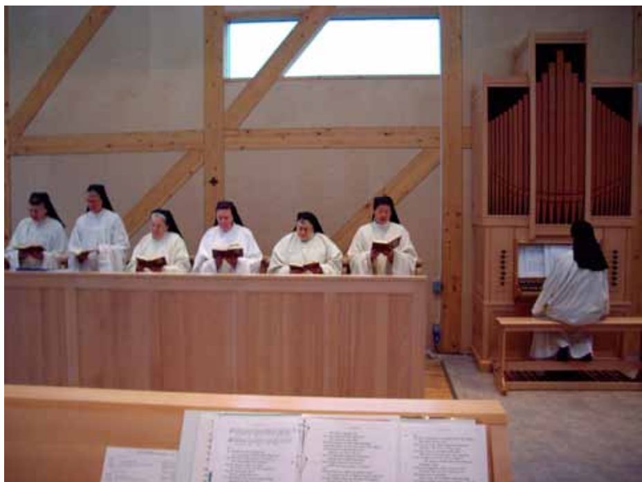
Tidebønner på Tautra

– Den nyfødte Jesus ble lagt i en krybbe, en matstasjon for dyr. Senere i sitt liv ga han seg selv som mat for oss – det evige livs brød. Som katolikker tror vi på Kristi realpresens i eukaristien. Reflekterer min religiøse praksis denne troen? Hvor ofte kommer jeg for å motta ham, for å tilbe ham? Kanskje kan jeg denne julen gjøre det oftere. Og ønsket mitt med boken er at den skal være en håndsrekning til nettopp dette!