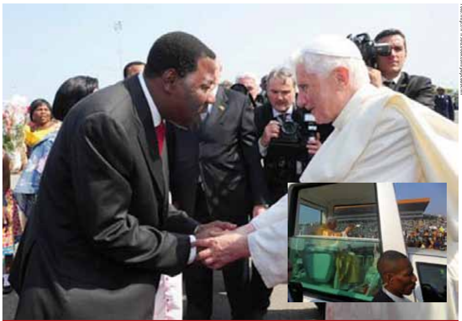
President Thomas Yayi Boni ønsker paven velkommen. Innfelt: pave Benedikt hilser folket fra sin «popemobil».

Landet karakteriseres av et godt forhold mellom kristne og muslimer og har unnslettet sammenstøtene som plager blant annet det mye større nabolandet Nigeria. President Yayi Boni kommer fra en muslimsk familie, men har selv blitt evangeliskal kristen, et trosskifte som ville vært utenkelig i mange andre land. Disse gode relasjonene kan ha vært blant grunnene til at Benedikt valgte å besøke nettopp Benin.