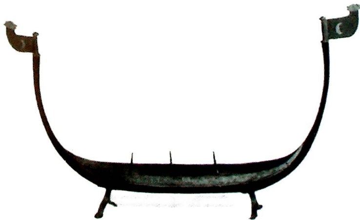
Illustrasjon fra boken: Lyseholder fra Dale kirke, Sogn.