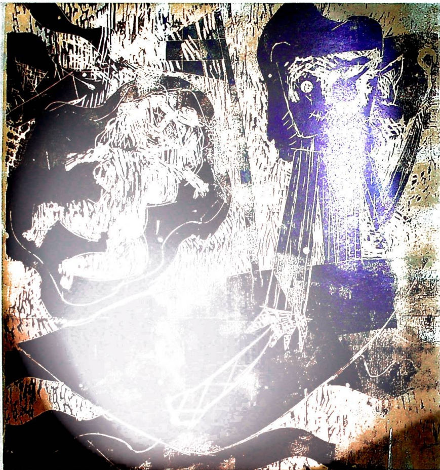
"Kaptein Krok" av Marianne Bratteli.

Som genre kaller jeg kunsten min symbolsk ekspresjonisme. Det er alltid figurer i bildene - et eller to mennesker, et dyr, et hus, noen trær - Tematisk ikke