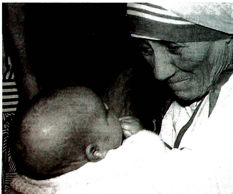
Mor Teresa 1910-1997