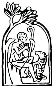
Vignett fra Katekismen.

liturgiske feiringer fortløpende. Men først er hele frelsesordningen blitt fremstilt som en "sakramental frelsesordning". Liturgien, som har sitt opphav og mål i Faderen, er den Hellige Ånds verk. Det handler om en "sakramental feiring av påskemysteriet".