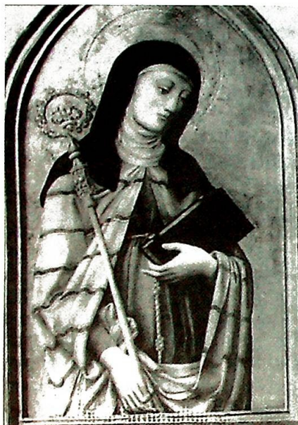
Den Hellige Klara - oljemaleri fra ca. 1467 av Antonio Vivarini; maleriet er nå i Wien.

Klaras lederstil var ikke herskerens. For henne var søstrene alt, hun underviste dem, ledet dem og sviktet dem aldri. Hun var deres åndelige rådgiver, og som sådan