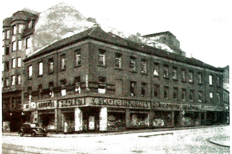
Huset der messen ble lest første påskedag 1843 - "på hjørnet av Storgaten og Youngsgaten"- så slik ut i 1943 og står der fremdeles.