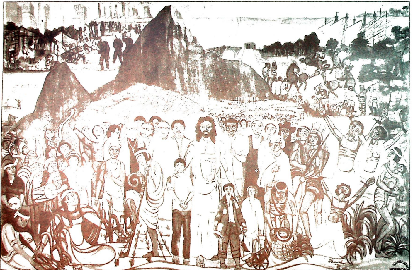
Adolfo Perez Esquivel, tidligere FN-generalsekretær og Nobelprisvinner, siden 1974 leder av den latinamerikanske fredsbevegelsen Fred og rettferd, har malt dette bildet som viser Latin-Amerikas historie fra Columbus gikk i land i 1492, den grusomme erobringen, dagens regimer som undertrykker medborgere frem til folkets befrielse der Kristus vandrer sammen med de jordløse landarbeiderne og martyrene; man kan gjenkjenne flere av diktaturenes ofre, bl.a. erkebiskop Oscar Romero.

Vi er glade og takknemlig for å kunne fastslå at denne nyorienteringen i Latin-Amerikas kirke virkeliggjør den hellige Frans' drøm om de fattiges kirke. Samtidig inne-