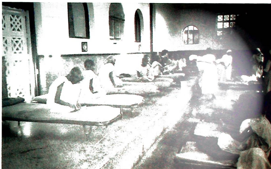
«Nirmal Hriday» eller «huset for de rene av hjerte» - Mor Teresas hus for døende, det første hus hun opprettet i Calcutta.

Overalt hvor hun ferdes, forsøker Mor Teresa å dele med de mennesker hun møter av den visdom hun har tilegnet seg gjennom et langt liv med religiøs erfaring i bønn og forsakelse. De viktigste poengene gjentar hun til stadighet og fargelegger gjerne med selvopplevde historier fra det daglige liv blant de fattige. Søstre og andre som står henne nær, har skrevet ned