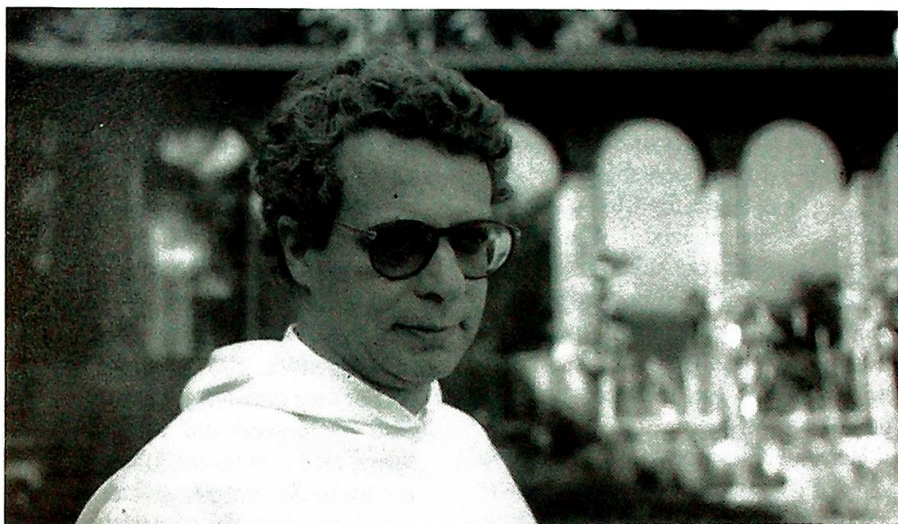
Den brasilianske dominikaner Frei Betto i klosterhaven på Lunden.