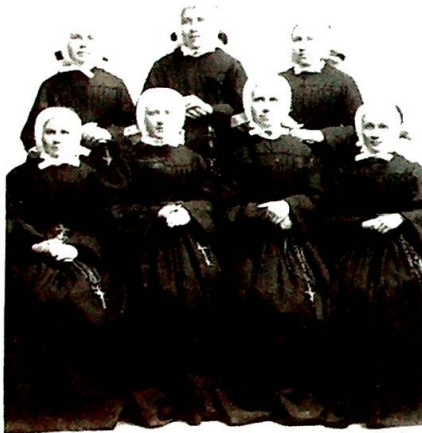
St. Elisabethsøstrene i Trondheim - “antagelig fra året 1896”.