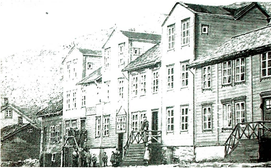
St. Vincents hospital i Hammerfest.

- og trakk tenner - tannlege var ukjent i Hammerfest i de dage!