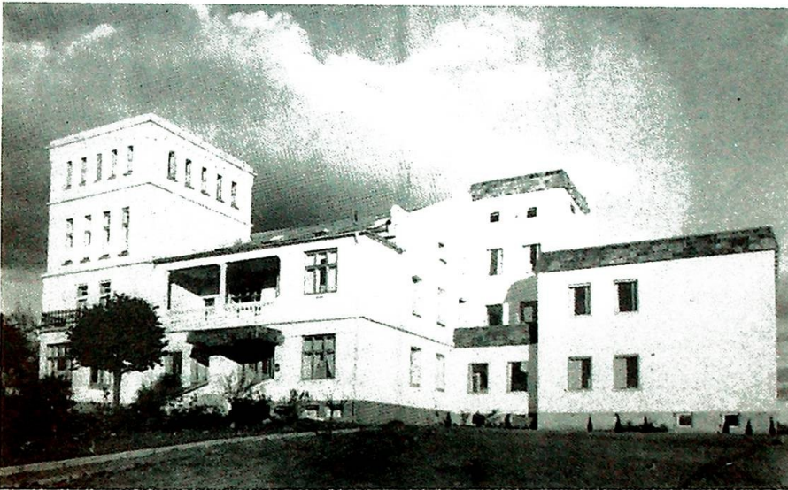
St. Olavs Klinik i Tønsberg slik den var - påbygget og tilbygget - da den ble solgt i 1974.

manglende opptatthet av en annen samfunnsgruppe: «Vi lukker øynene for unge kvinner med tre barn og jobb og husstell – som ingenting legges til rette for. Halve barnevognen henger utenfor trikken når dørene smekkes i, mannfolk blir rolig sittende mens gravide står.»