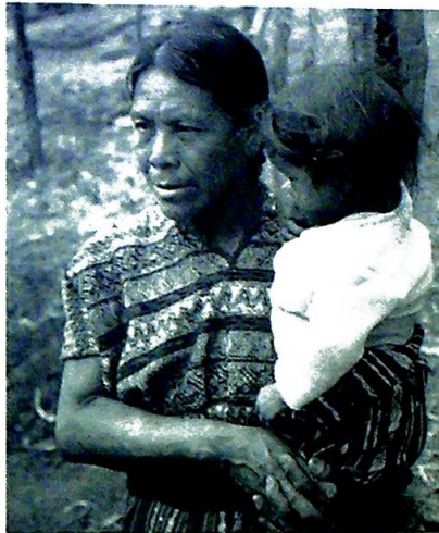
Både Kirkens Nødhjelp og Nordisk Katolsk Utviklingshjelp driver kvinneverretted bistand i det herjede Guatemala.

Maya-indianernes etterkommere i Guatemala holder på sin kultur og sin husflid. Litt penger kan en indianerkvinne skaffe seg ved å selge vevnader på markedet i San Martin. Jentene lærer seg å veve fra de er 8-10 år gamle. Alle barna i Enke-