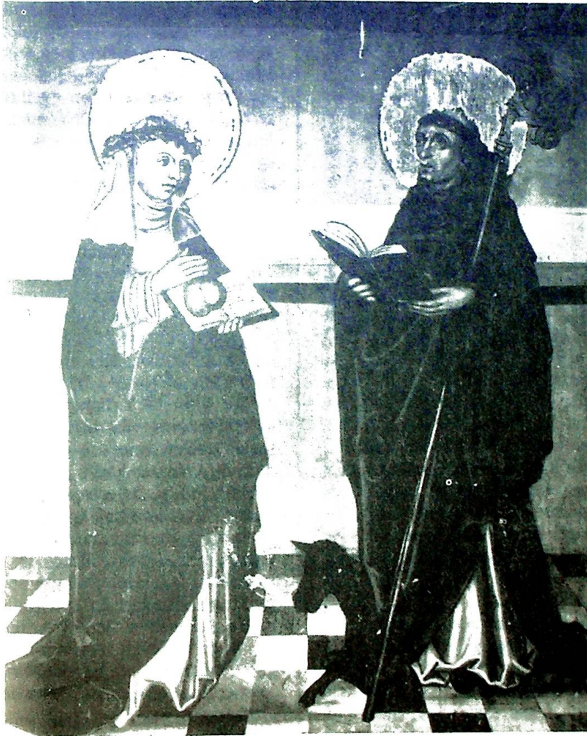
Også i norsk kirkekunst finner vi St. Katarina; her sammen med St. Egidius på døren til alterskapet i Vevring kirke.

tro på Guds nåde, som er større enn all verdens synd.