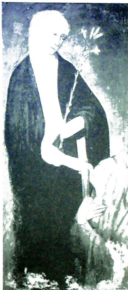
Katarina av Siena. Freske av Andrea di Vanni fra 1379 på en søyle i dominikanerkirken i Siena, eneste samtidige portrett; liljen, renhetens symbol, er malt til senere.

Katarina etterlot seg utallige skrifter av forskjellige slag. Mye er tapt, men likevel er det bevart ca. 400 brev og et tyvetalls bøtner, i tillegg til «Dialogen», hennes teologiske testament. «Dialogen» er formet som en samtale mellom Vårherre og henne selv. Den omhandler forhold i kirken og i verden, henne