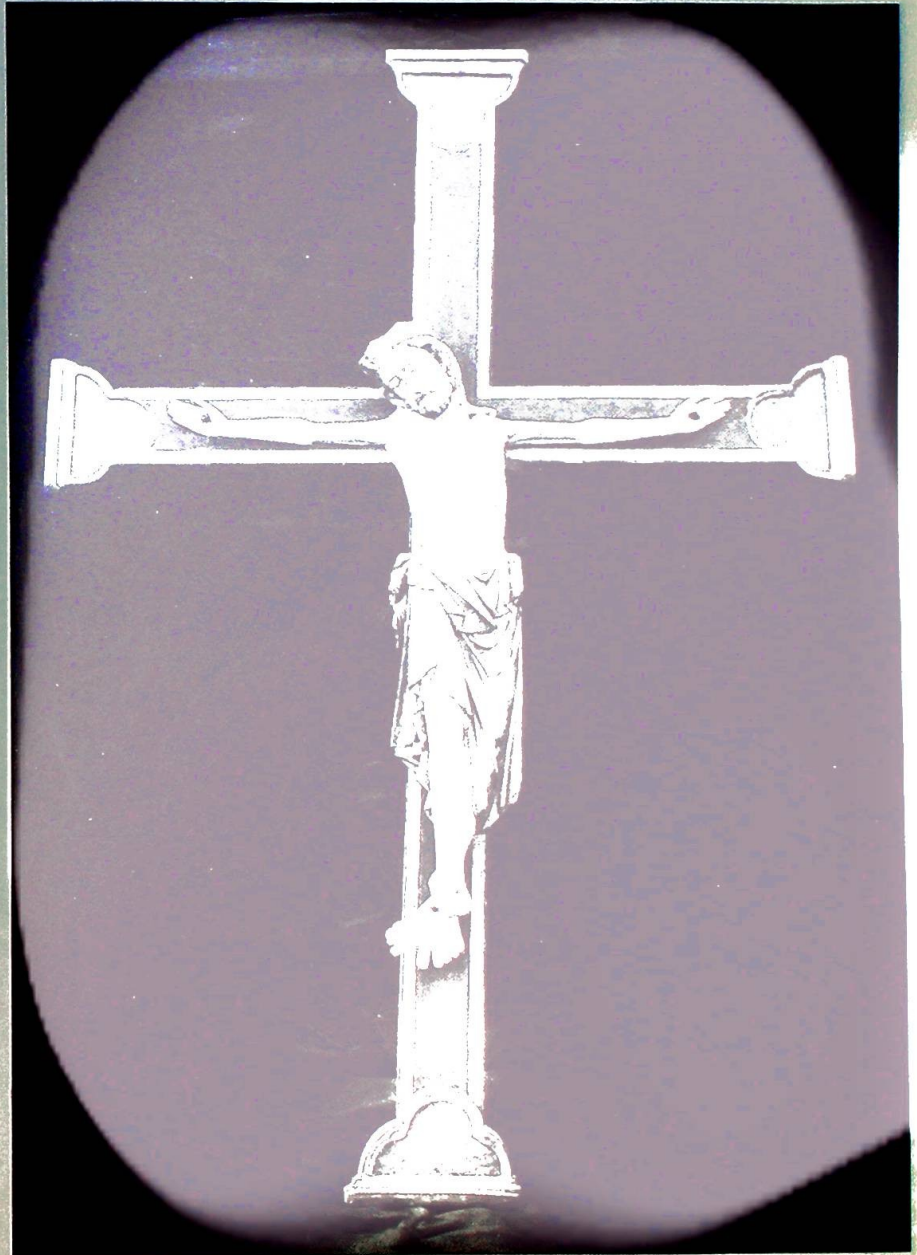
Det undergjørende krusifiks i Røldal stavkirke.

Så tidlig som omkring år 1300 var kirken kjent som en særlig helligdom, og etterat krusifikset fikk plass der, øket valfarten dit. Det ble tidlig skapt en særskilt