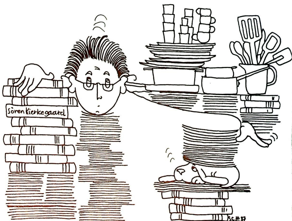
Tegning av Sigrid G. Holm.

Om han hadde lest Søren Kierkegaard, er ikke godt å vite, men at han var meget vel fortrolig med de eldgamle dørene i Salme 24, er nok ganske sikkert. Da jeg takket for meg og føyde til at jeg aldri hadde hørt så vakker liturgisk sang før, sa han med et stort smil: «Du skjønner, vi har hatt god tid, og vi har øvet på dette i mer enn tusen år!»