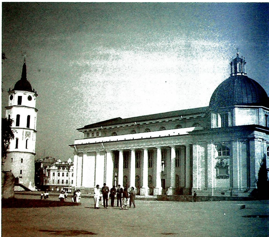
Domkirken i Vilnius – kirketårnet til venstre, – kirken brukes i dag som museum. I en resolusjon i anledning 600-års jubileet for kristendommens innførelse i Litauen, appellerer USAs biskoper til de sovjetiske myndigheter om å gjenåpne domkirken i Vilnius og Fredsdronningens kirke i Klapeida. Biskopenes ønske er i tråd med Helsingfors-avtalen og andre internasjonale avtaler om menneskerettigheter. Ifølge en artikkel i The Tablet nylig er Litauen det «østland» hvor Kirken har de hårdeste kår.

I 1955 begynte en langsom bedring av kirkens kår. To nye biskoper ble vigslet, og året etter fikk 2 biskoper og 130 prester amnesti og vendte tilbake fra Sibir. En viss produksjon av religiøse bøker ble tillatt. Og folkets religiøse liv har selv ikke de strenge administrative tiltak kunnet sette en stopper for. «Fra 1968 og til dags dato har alle forsøk på å innskrenke religionsutøvelsen i Litauen blitt møtt med skriftlige protester om brudd på konstitusjonen . . . og hver enkelt ble signert av ikke mindre enn 17.000 personer,» noterer Ravnum i den tidligere nevnte kronikk. Han henviser til undergrunnsavisen Ba'zny'cias Kranika (Den katol-