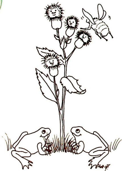
Tegning av Sigrid G. Holm