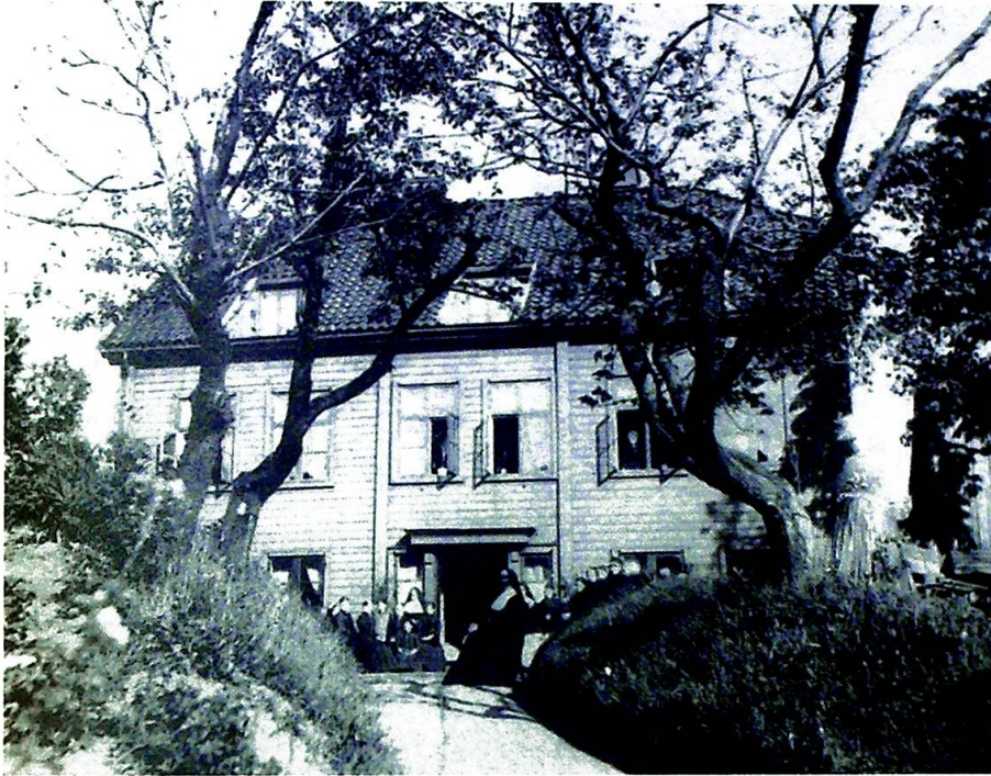
Slik så Vor Frue Hospital i Christiania ut i 1883. Det var St. Josephsøstrenes første sykehus i Norge – en hel rekke skulle følge etter.