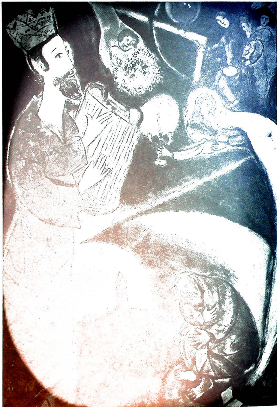
Marc Chagall: Kong David

Med utgangspunkt i den jødiske trostradisjon begynte altså en ny tro å ta form. Guds utvalgte folk var ikke lenger begrenset til jødene, men innbefattet alle verdens folkeslag. Teologene og Kirken tolket gamle begreper i en ny sammenheng. Kirken ble symbolet på det nye Jerusalem. Kirken gav ny næring og nytt innhold til Salmene. Salmene ble også hyppig sitert av Det Nye Testaments forfattere (mer enn hundre ganger, se bl.a. Mt. 21,42, 26,30, 27,46, Lk. 23,46 etc.). Faktum er at generasjoner av troende, jøder som kristne, har latt og lar seg