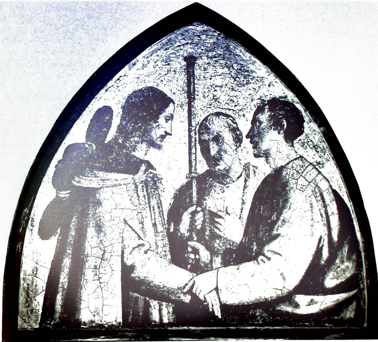
Disiplene på vei til Emmaus - av Fra Bartolommeo