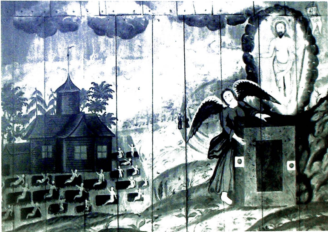
Fra Brandstorp kirke i Sverige - malt i 1748.

død og evighet, går inn på reinkarnasjon og sjelevandring, omsorg for døende og medisinske kriterier, forholdet mellom Guds rike og vårt arbeid for et menneskeverdig jordeliv, verdens fremtid og trusselen om utslettelse. Han stanser også ved ulike retninger innenfor katolsk teologi med en viss preferanse for den «håpets teologi» som Johannes Metz har utformet.