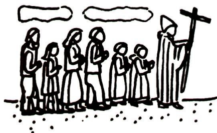
Fra Ungdomsbønnen «I ditt nærvær» - ill. av Liv Benedicte Nielsen.

Jesus døde ikke bare for alle kristne. Jesus døde for alle mennesker over hele den vide jord.