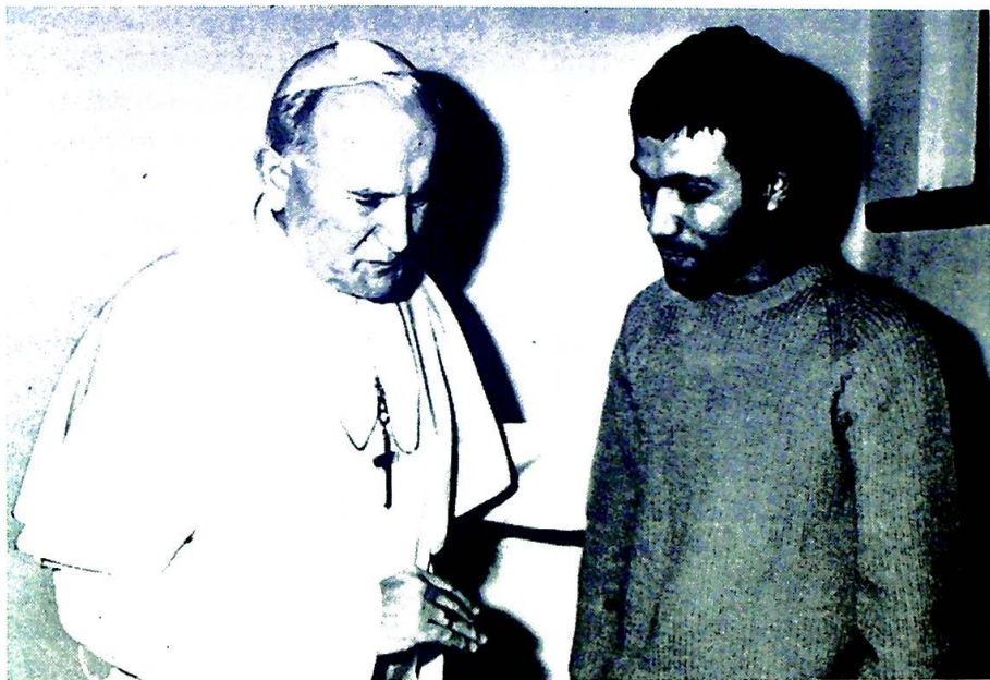
Paven og attentatmannen.

som arvtager til sitt soningsverk. Derfor er kirken fortsatt redskap for, tegn på og sakrament for forsoning.