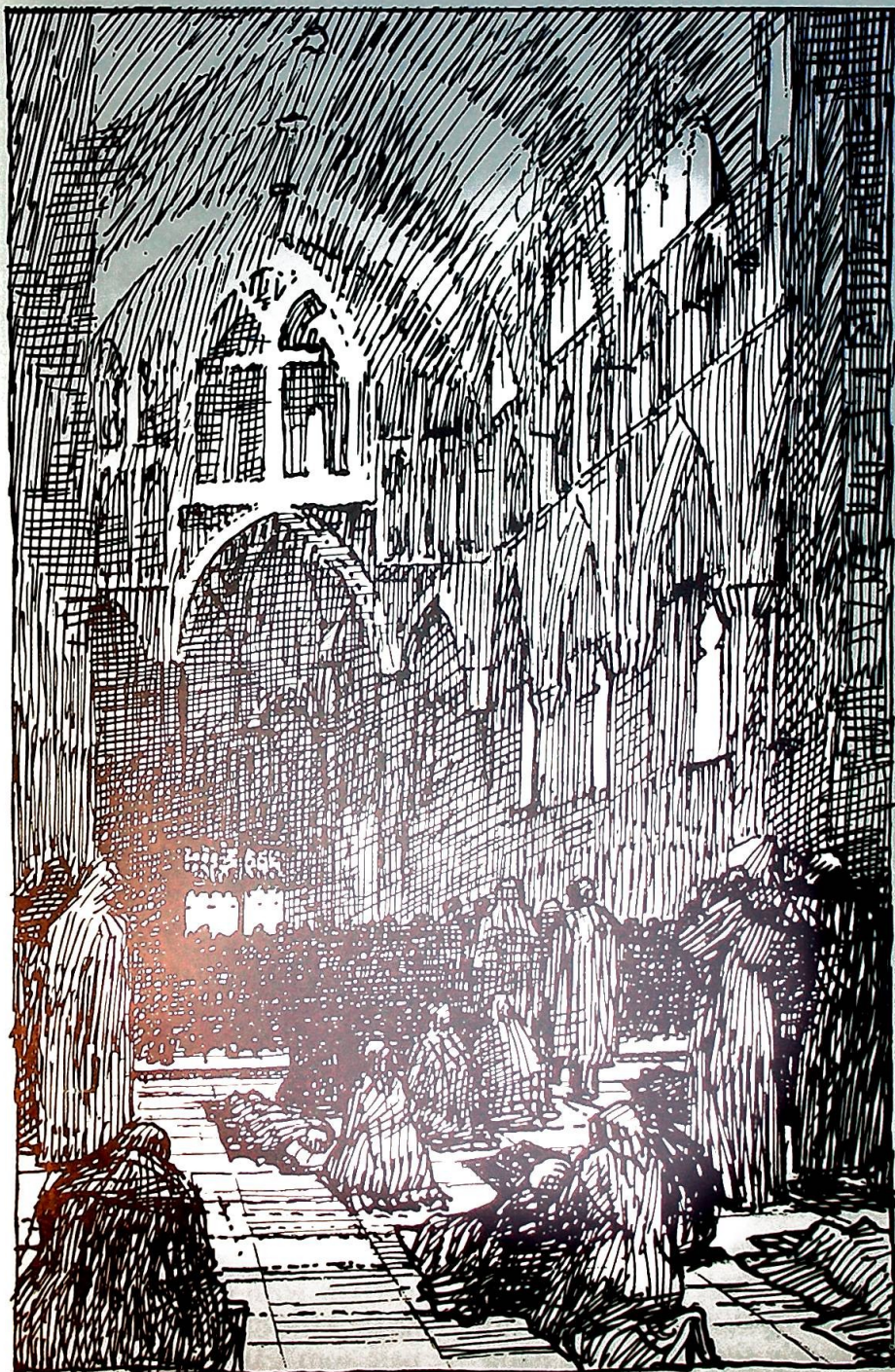
Ill. av Håkon Stenstadvold, til Sigrid Undsets «Korset».

pakts måltid. Under tegn av brød og vin, forvandlet til hans legeme og blod, innstifter han minnet om det offer han dagen etter skulle frembære på korset. - Jødene spiste sitt påskemåltid stående, med sko på føttene og stav i hånd - i det øyeblikk de skulle dra ut fra Egypt (exodus: utgang), Jesus og disiplene spiser sitt påskemåltid like før Jesu «utgang».