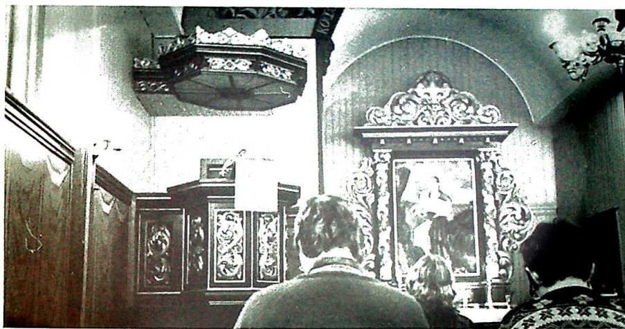
Kvinner fra ulike konfesjoner samles hvert år på Mjuklia til ettertanke og meditasjon.