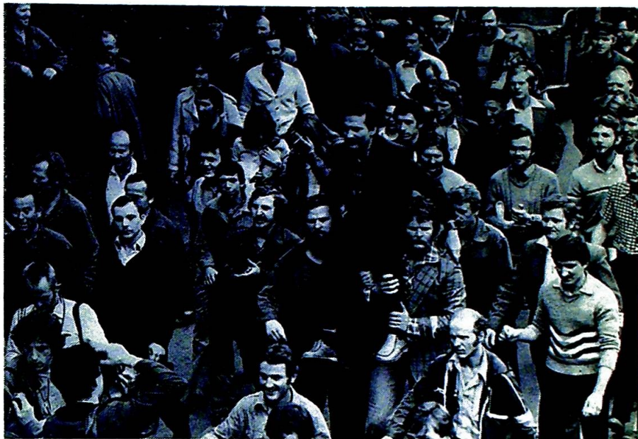
Solidaritet er mer enn betegnelsen på en politiserende fagbevegelse. I Polen blir det mer og mer et kvalitativt alternativ.

Jesus. Det samme spørsmål stiller vi fortsatt i dag, også når vi mener å burde vite hva sannhet er . . .