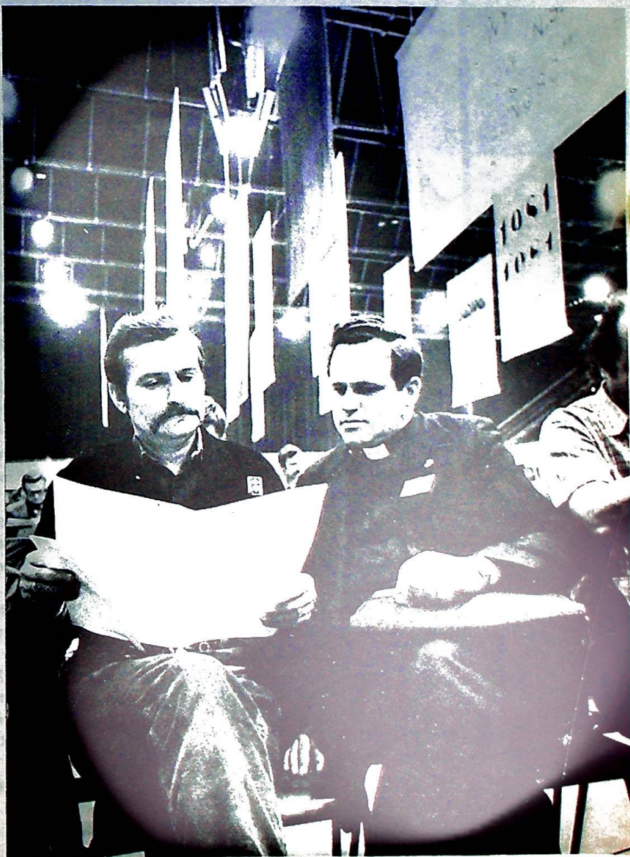
Det er en kjent sak at Den katolske kirke har et fast grep om den polske befolkning, men det er like meget den jevne mann som har et fast grep på sin kirke.