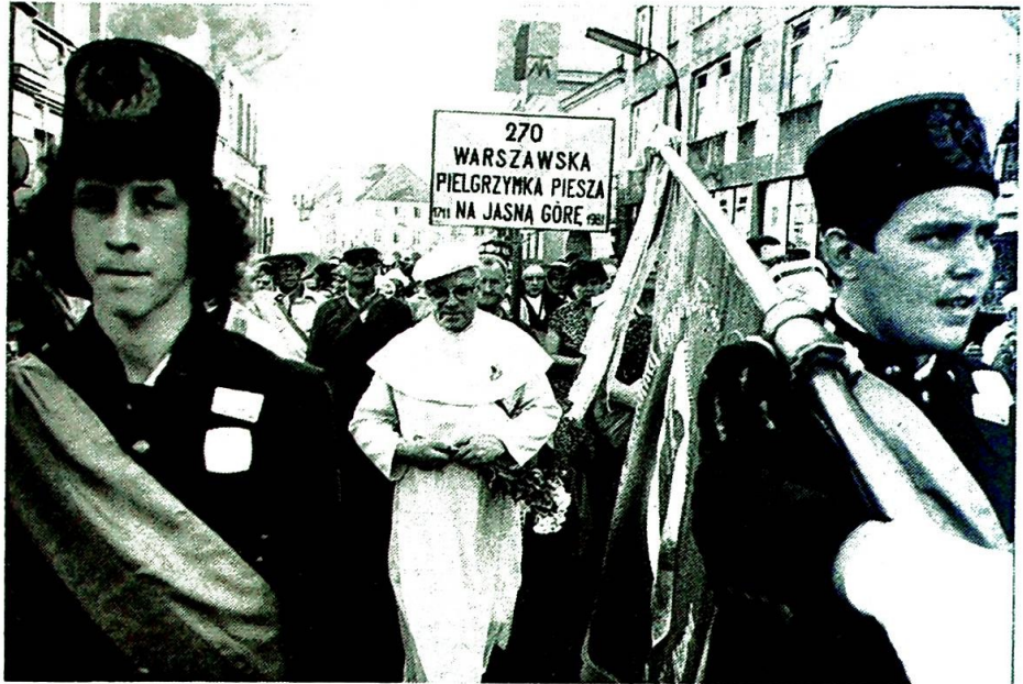
Oasebevegelsen i Polen er solidaritetens og kjærlighetens revolusjon.

Antallet av disse har økt hvert eneste år. På ti år har tallet økt fra 1000/1500 til 45 000/50 000 på siste års leirer. Når ungdommene kommer tilbake til sine byer, fortsetter de å samles. Men ikke bare det, alle gruppene motiveres til å drive aktiv evangelisering. De går ut med det