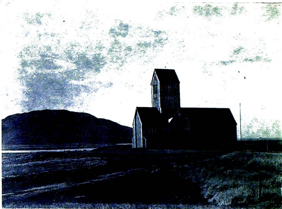
Her var det den navnkundige Jon Arason var biskop på reformasjonstiden. Den moderne kirke ble bygget 1955 - 60 og bærer vitnesbyrd om kristendommens herredømme på Island i 1000 år.