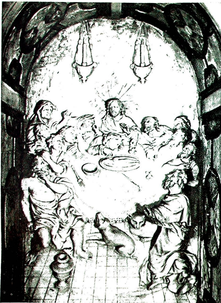
Dette bilde, som forestiller den siste nattverd, er fra det attende århundre og finnes i domkirken i Zagreb.

tyrkere. Når det gjelder «stridighetene» med tyrkerne, så har kroaterne mange og harde kamper å se tilbake på, men de kjempet tappert for å verne sitt område og sitt folk.