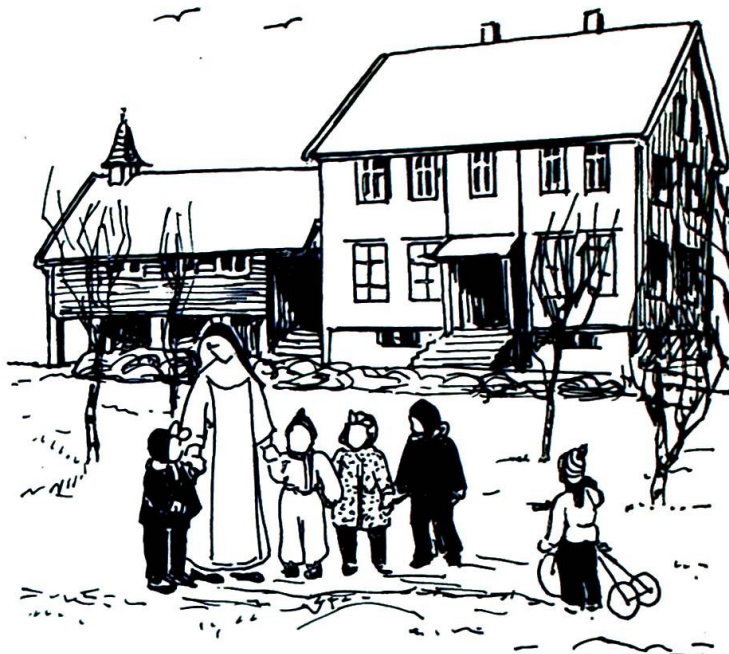
Er klosterkallet bare drøm, eller er det hardt arbeide og kjærlighet til nesten?

— Puh, det var litt av en salve! Du høres temmelig overbevist ut. Jeg kjenner forresten den lekse der, den kommer du med hver gang du ikke finner deg helt til rette på noe annet sett. På den andre siden, etter to år her virker det som om det ikke bare er hjernespinn. Det kan vel godt være at det er noe å bygge på og som holder. Når jeg sier det, så vil jeg også gjøre det klart at jeg ikke kommer til å la deg være i fred for kritiske spørsmål i fremtiden. Bare vent!