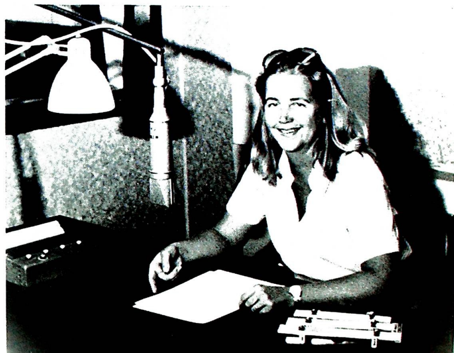
Vatikanets radio følger med tiden. Det er ikke lenger en sortkledd pater som står for utsendelsen. Kvinner har også lytternes tillit.

Vatikanradioens historie har vært omskiftende. Under den annen verdenskrig sendte den ut over en million etterlysninger om savnede og forsvunne på en sendetid av totalt 12.000 timer, dvs. åtte timer i gjennomsnitt hver dag.