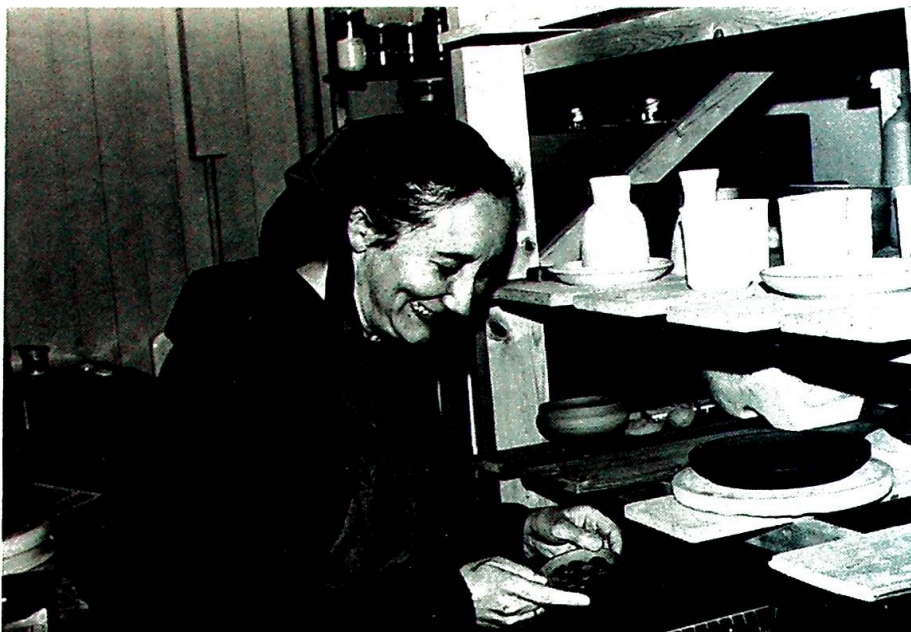
Jobben spiller en stor rolle for Jesu Små Søstre. Her er det keramikken som engasjerer.