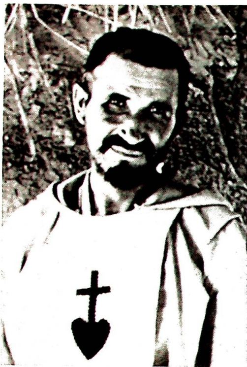
Offiseren, vitenskapsmannen og eneboeren, hvis tanker og idealer i dag danner grunnlaget bl. a. for Jesu Små Søstres virke også i Norge.