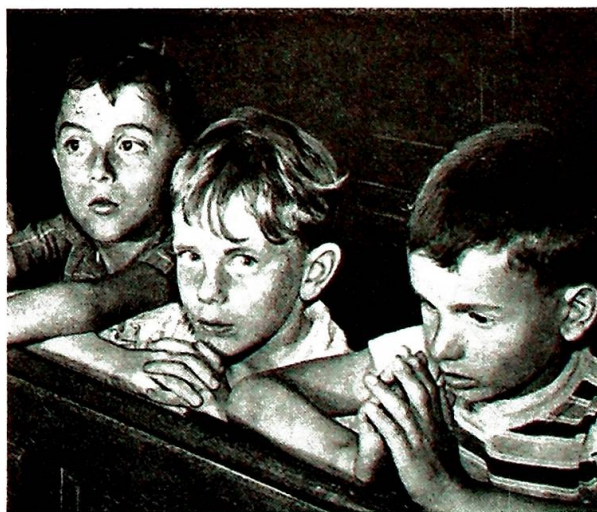
Hvis den oppvoksende slekt skal nyte godt av kursvirksomheten på Mariaholm, må norske katolikker av i dag kjenne sitt ansvar.