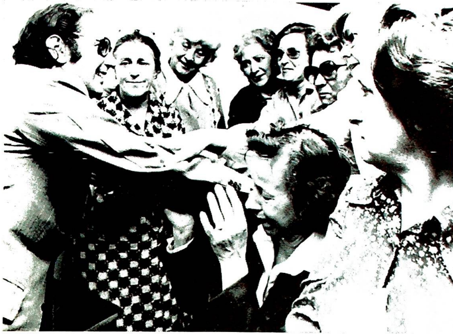
Esquivel har en stor støtte i de argentinske kvinner.

gjennomlever Latinamerika angsten for en ujevn økonomisk vekst der folket ikke får delta.