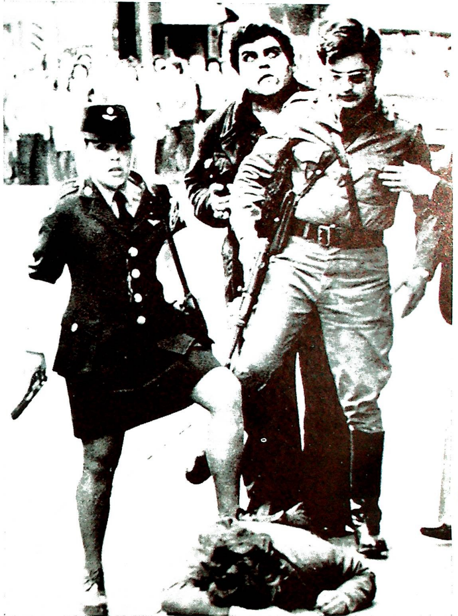
«frykt, usikkerhet, angst er også vår skjebne.»

Den tyske evangeliske kirkes råd (EKD) har oppmuntret sine sytten delkirkers 10.600 menigheter til å utdype de bestående kontakter med katolske nabomenigheter, og søke etter nye muligheter for å utvide den økumeniske kontakt mellom de to konfesjoner. Av