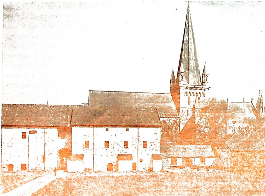
Den første dagen var rettet mot Nidarosdomen og den rikdom som er knyttet til denne kirken.