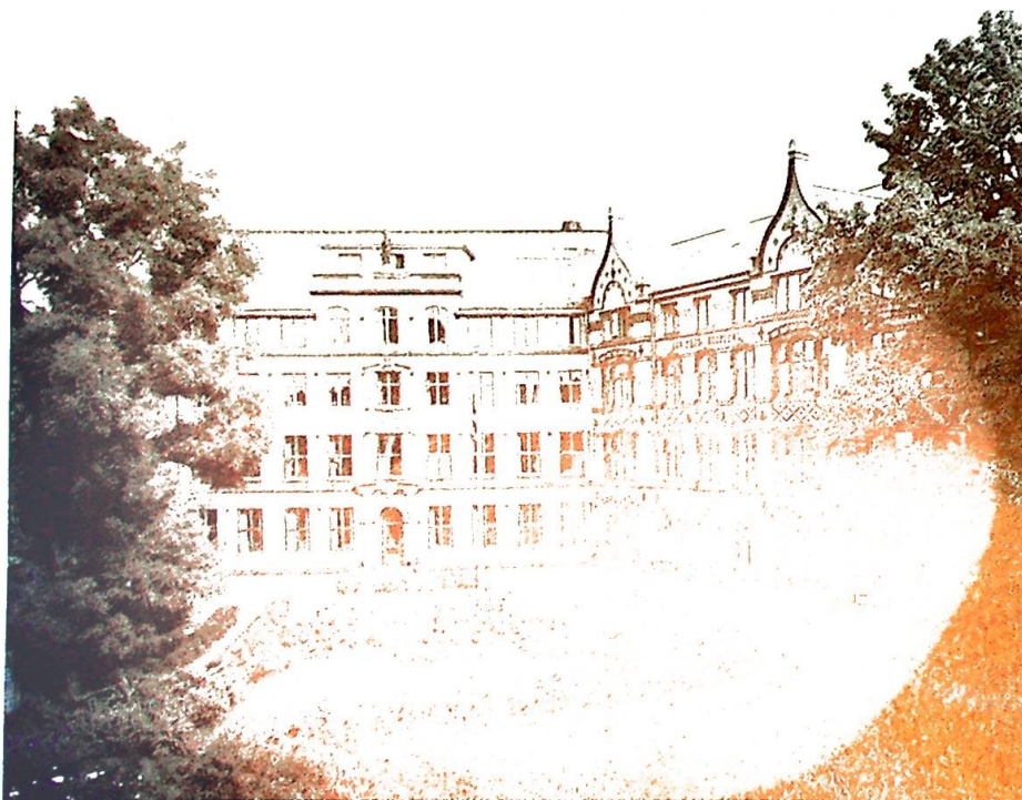
Vor Frue Hospital.

Vi kan tenke oss at søstrene levde meget fattig. Det var sjelden penger i kassen den første tid. Mer enn én