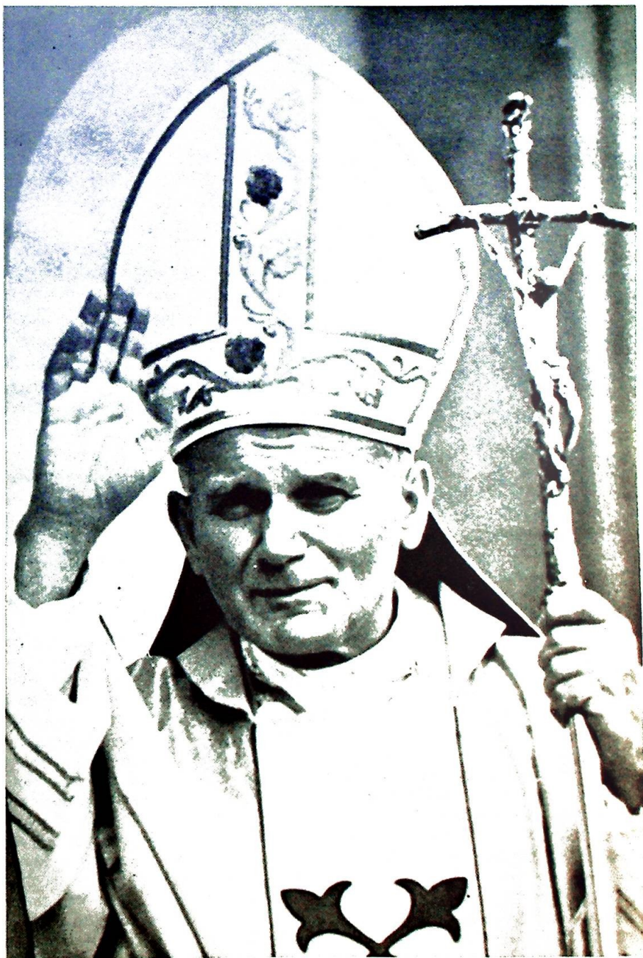
Johannes Paul II har vært professor ved universitetet i Lublin.

skapelig kontakt med alle universitetssentra, særlig i land med kristen kultur. Men man forsømmer ikke dermed arbeidet i sitt eget land. Anstrenge går heller ikke bare ut på å opprettholde kontakten med andre vitenskapelige kretser, men også å utvikle dem. KUL vil gjerne være en skapende faktor i hele det polske folks liv og samtidig være nært knyttet til den dynamiske, vitenskapelige utvikling i verden forøvrig — ganske særlig når det gjelder å utbre den kristne lære.