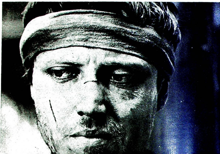
Christopher Walken fikk årets Oscar for beste mannlige birolle for sin tolkning av Nick.

Filmene er lang. Første delen er kanskje for lang, til tross for høy kvalitet. Vi «deltar» bl. a. i et bryllup, og det varer riktig så lenge. Skildringene fra Vietnam virker ærlige nok. Enkelte har reagert på at det blir vel direkte når vi i detalj ser hvordan det går for seg når et menneske skyter seg i hodet. Antydningens kunst er ikke særlig flittig brukt her. Men undertegnede mener en slik direkte skildring kan være på sin plass. Krig er stort sett noe av det gru-