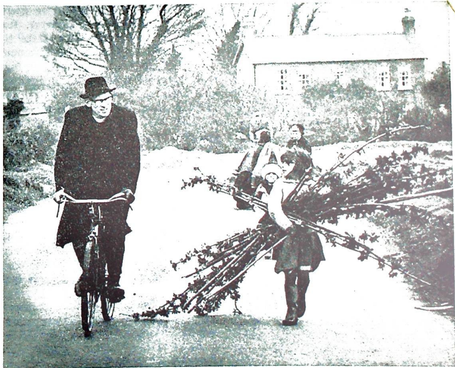
Presten — lett synlig i landskapet. Men hvor lenge?

Det må noen fortelle menneskene, med sine ord og sine liv. Han valgte seg tolv venner til det. Så 72. Og siden så mange, stadig nye mennesker, helt frem til i dag. Kirken taler ofte i gammeldagse vendinger og den tar altfor gammelmodig vare på det som heter «kallet». For det kallet er dens ungdom og livsnerve. Uttrykker den seg igjen klart, og tenker den livets stadig nye behov, snarere enn bare sine egne tradisjoner, vil det kallet gripe tusener på tusener av nye, unge mennesker, også lenge etter at de yngste blant oss i dag er døde og glemte. Kristus har en ild, og han vil at den skal brenne. Det har vi hans egne ord for. Hans vilje og hans ord. Det er egentlig rikelig nok.