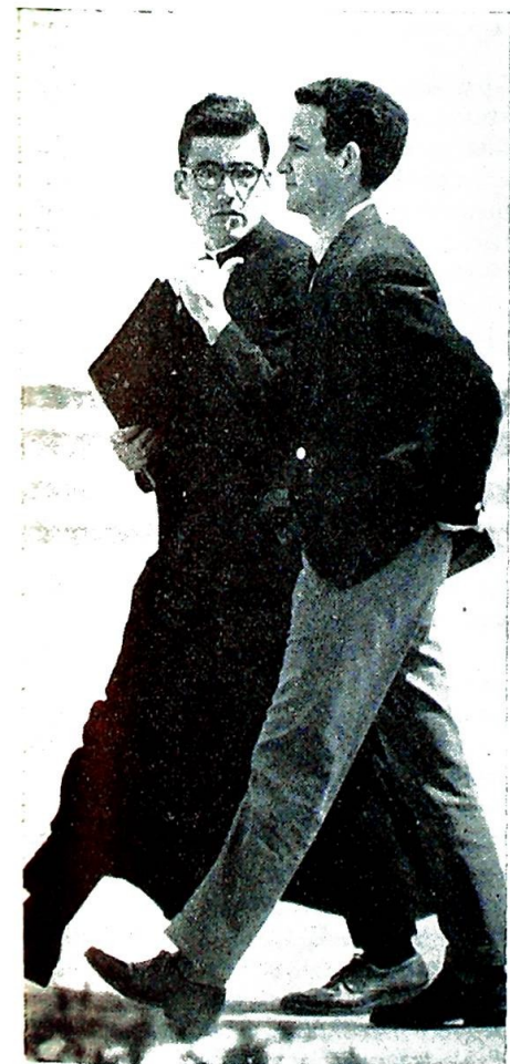
Prest og legmann — frem eller tilbake?