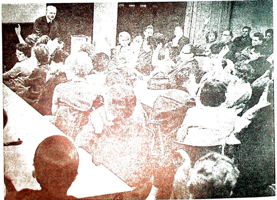
Det er ikke bare i våre menigheter man i disse dager er opptatt av valgene til menighetsråd — også for eksempel tyske katolikker er livlig engasjert i slike forberedelser for tiden. Bildet gir antydning av «valgkamp» og «fulle hus».