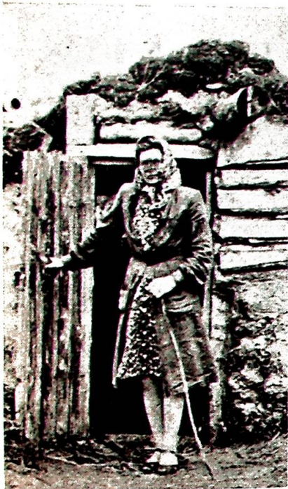
Tusener lever i fangeleirer og forvist til Sibir — mens åndskampen pågår. (Ansjektet på denne kvinnen er retusjert vekk.)

P ave Johannes minnet engang den katolske kirke om at det kommunistiske system er en trussel mot frihet og menneskeverd, men at den enkelte kommunist er et menneske som oss selv, under den samme utvikling og forandring. De siste måneders hendelser i europeisk politikk og de nådeløse, stupide overgrepene mot Tsjekkoslovakia har nok åpenbart for mange hvor rett han hadde, vi gjør felles sak med tusener av trokommunister i Praha og Bratislava — her kjemper vi samme åndskamp.