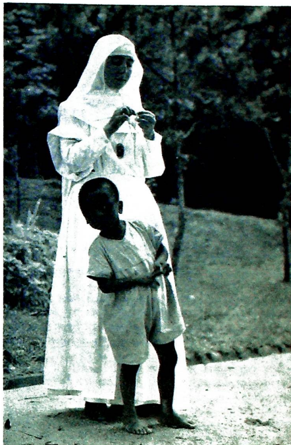
De som kjenner dagens Kongo vet hva landet egentlig skylder den kristne misjon, og vet at her er hjelpen effektiv.

— Ja, si litt om skolene dernede, de må vel antas å være avgjørende for dette samfunnets levedyktighet?