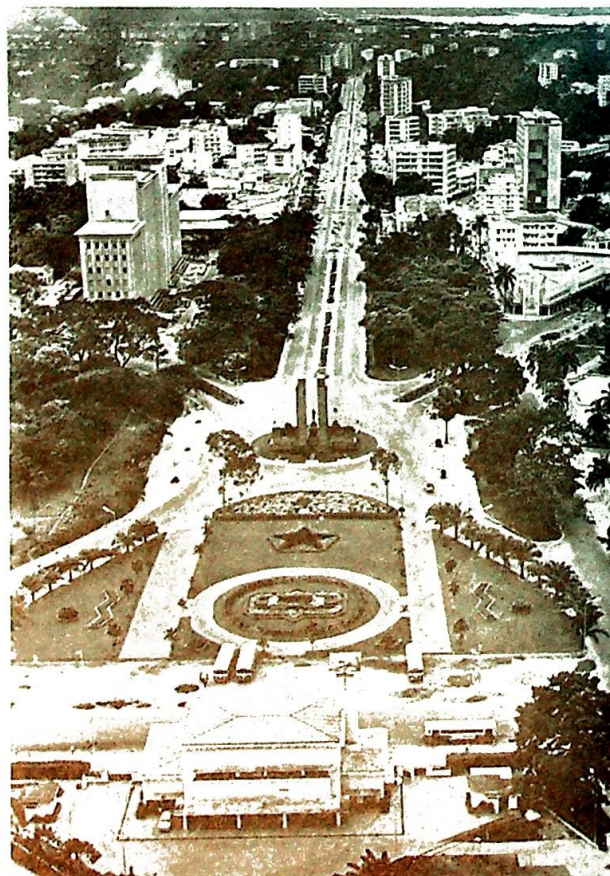
Kongo er ikke bare jungel og landsbyer — Leopoldville er en moderne storstad.