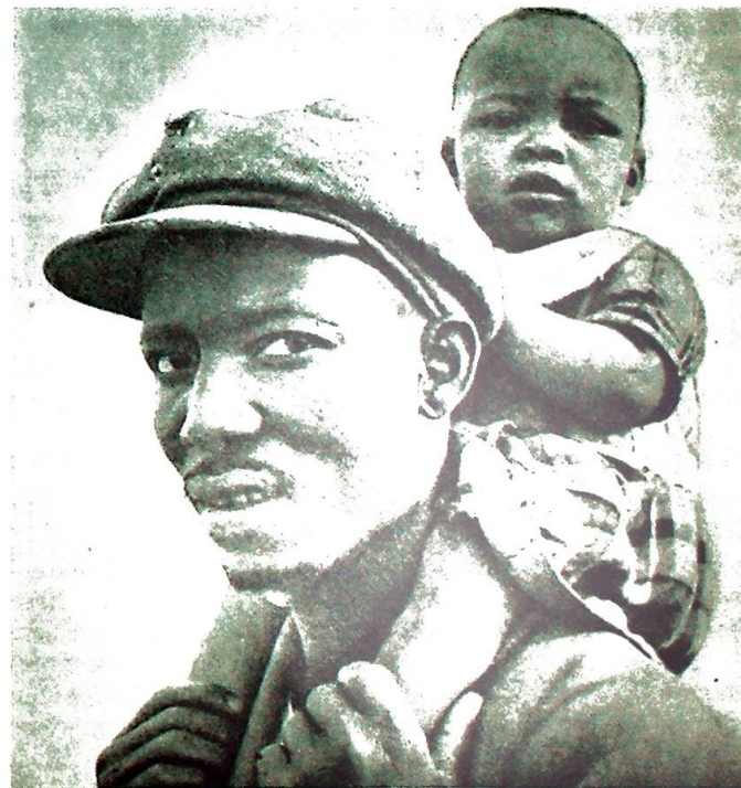
Han må hjelpes — men det er vanskeligere enn vi ofte tror.