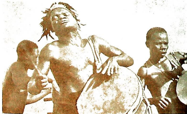
Veien fra tam-tam-rytmene til den gregorianske kirkesang er ikke så lang.

flytelse i Kongo. Avviklingen av kolonistyre klargjorde noe meget viktig: Nemlig at Kirken og det belgiske styret slett ikke var det samme, og kongoleserne ser jo i hundre forhold hva kristendommen gjør for deres vel