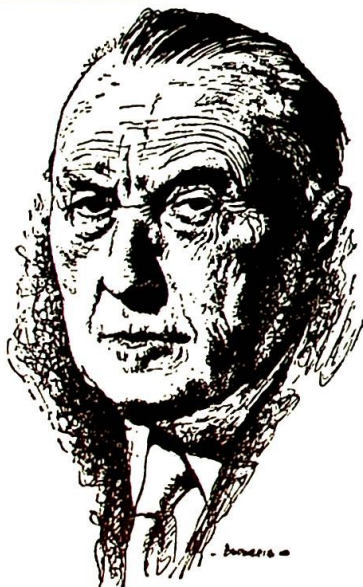
Forbundskansler Konrad Adenauer.

Nifst nærværende som en stadig angst— og urofaktor er også Tysklands tvedeling, som en blir minnet om hvor