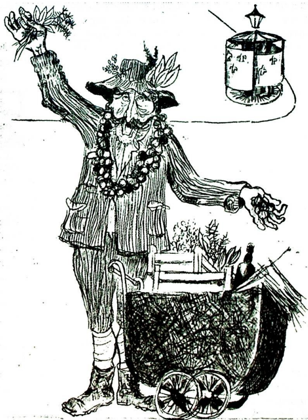
«Timian, rosmarin, hvitløk og persille —» Gateliv i Paris, slik Lars B o ser det. (Ill. fra boken.)

Psykiateren føler seg åpenbart ikke så mye sikrere på at her går riktig frem mot tiltalte. Med adskillig finfølelse sier han: