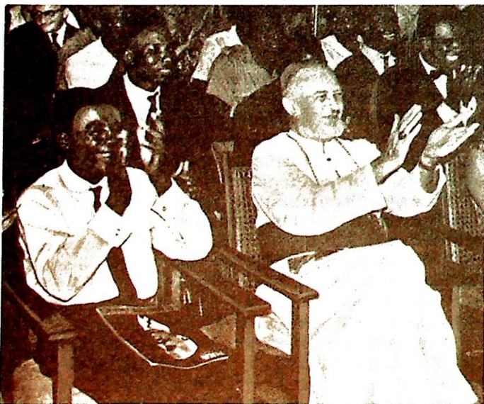
Når «politikk» betyr bitre stammefeider og personoppgjør kan en film som MRA's «Frihet» ha en gagnlig innflytelse, og erkebiskopen av Coquilhatville i Kongo har all grunn til å applaudere.

Mange kristne MRA-folk vil protestere mot dette bildet vi tegner her, og de vil hevde at der finnes ikke noen slik motsetning mellom MRA og kristendommen. Imidlertid må man være klar over at kristendommen danner et ubrytelig hele, og det lar seg ikke gjøre å skille ut av den enkelte moralske prinsipper og utgi dem for svaret på verdens problemer, uten at helheten blir skadelidende. Og i den grad bevegelsen forlanger å bli tatt alvorlig nettopp som «ideologi», må den også akseptere at man forsøker å analysere dens ideologiske struktur.