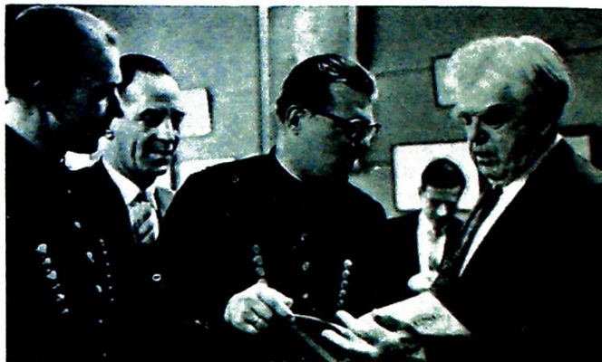
Et gjennomgående trekk ved MRA-propagandaen er fotos av MRA-team i samtale med ledende politikere. Her er tyske grubearbeidere på besøk hos «the boss» — den amerikanske fagforeningspresidenten John L. Lewis.

For at man skal finne mer i bønner enn praktiske direktiver, kreves det nemlig også at man forstår at religion er mer enn moral, og at moralen er uatskillelig for hva man tror — og hvem man tror på. Og hva har MRA å si om det?