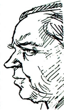
KF's Wikborg — en uheldig hånd.

Der har vært talt om Stortingets «verdighet». Den synes å være truet fra mer enn én kant i en slik sak som denne.