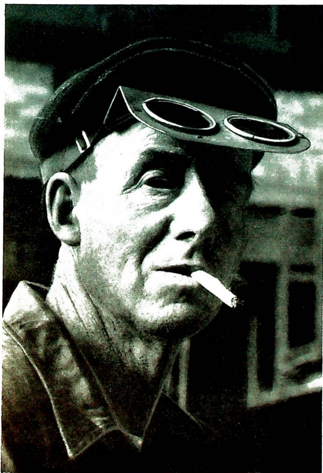
Arbeideren — utakknemlig som alle andre?

— Se Dem omkring. Hvilken stand eller klasse i Norge idag slår oss egentlig ved noe skapende kulturoverskudd? Forretningsstanden? For meg står det snarere slik, at i sin kamptid måtte arbeiderne finne inspirasjon og selvbevissthet ved å rendyrke en særlig arbeiderkultur. Men