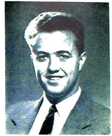
Lars Roar Langslet — Studentersamfundets for- mann i vårsemesteret.

Som studentenes interesser overhodet er programmet dominert av de politiske spørsmål, men med aktuelle streiftog inn i den mer abstrakte tenkningen og i litteraturen. En rundebordsdebatt 20. februar mellom «humanister» og «realister» heter treffende nok: «Har vi råd til ikke å forstå hverandre?» Dikterne Alf Larsen og Paal Brekke skal i mars sette norsk etterkrigslitteratur «på anklagebenken». Ellers fester vi oss særlig ved fire berømte utlendinger: Arthur Koestler taler i april over et ennå ikke oppgitt emne. T. S. Eliot lar seg muligens fange inn under et Norges-besøk på vårparten. Giorgio La Pira taler 14. mai om mulighetene for Europas enhet. Og en annen verdensberømt, fremskrittvennlig katolsk legmann, redaktøren for den ansette og ubestikkelige pariser-avisen