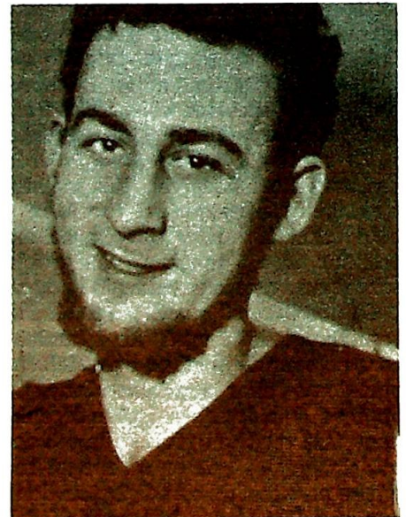
Neste- kjærlighet . . .

En behøver vel knapt være kristen for å innse det farlig kortsynte i dette. I alle nasjoner finnes der et bunnfall — også i London har man forøvrig de siste årene hatt raseopptøyer av en temmelig ondartet karakter. Slår vi derimot et folks elite i hardtkorn med bunnfallet, og handler deretter — da kan der til slutt gå troll i ord. Det er ikke mulig å se at der finnes noen annen realistisk og kristen løsning i forholdet til Tyskland enn helhjertet å satse på det gode, det beste