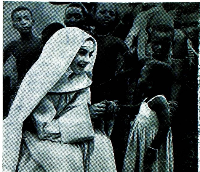
Filmens eneste smil: Blant de innfødte i Kongo.

Hepburn smile eller more seg over noe (og forresten heller ikke de andre søstrene) og det er et meget dårlig tegn. Hun forteller oss flere ganger at hun er lykkelig, men vi kan neppe tro det. Vi ser henne aldri riktig lykkelig eller glad. Like fra første ferd av er hun mer opptatt av sine egne problemer enn av Gud og bønnen. Det lykkes henne aldri å bli kvitt sine kompleksser. Etter sytten års forløp er hun tilsynelatende den samme som den første dagen. Det er det hun blir klar over, og det er derfor hun forlater klostret. Men når hun gjør det, er det simpelthen fordi hun aldri skulle være gått inn i det. Hun er i den beste mening av verden gått vill i klosterlivet.