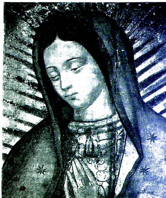
Vår Frue av Guadalupe. — Detalj av nådebildet.

Alle disse symptomatiske forandringer gjør at en er noenlunde forberedt når en møter det storslagene syn, Mexico City. (Skader forårsaket av jordskjelvet den 28. juli i fjor, er alt fullstendig reparert.) Den er nå den fjerde største by på den vestlige halvkule, og med sin befolkning på 4.5 millioner, viser hovedstaden alle mulige tegn på en fenomenal vekst. Den gamle bydel er den samme som før, den uforgjengelige plass i spansk kolonialstil, torvene med fargesprakende frukt og blomster, de smale gatene med en brun sværm