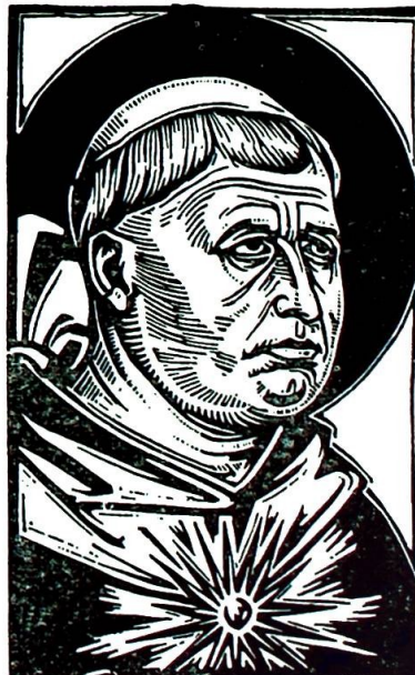
St. Thomas — i Julekatalogen.

Vi har et enormt behov for å få vite hvilke krav som må stilles til en menneskelig handling for at den skal kunne signeres god . Ganske enkelt: god. I dette eksistensproblem har vel ingen loddet dypere enn Thomas av Aquino. Det irrasjonelle både i moral og tro har han systematisert til et maksimum av rasjonell forpliktende klarhet. Hans dristige forsøk på å skape syntese mellom religiøs følelse og