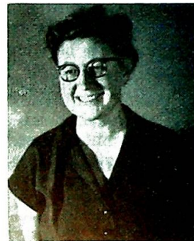
N.K.K.F.s nye formann.