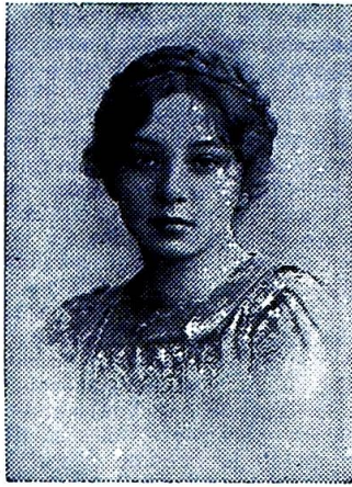
Ungdoms- portrett 16 år.

Mai måned har blant annet stått i Sigrund Undsets tegn. Den 20. mai var det 75 år siden hun ble født, og det er i år likeledes 50 år siden hennes første roman, «Fru Martha Oulie» ble lagt frem på bokhandlerens disk. Det hører ganske visst til de små jubileer, men til gjengjeld omkring et stort menneske. Begivenheten har fått bred plass i pressen, og ellers har hennes forlag — Aschehoug — og Universitetsbiblioteket begge på hver sin måte markert minnedagen.