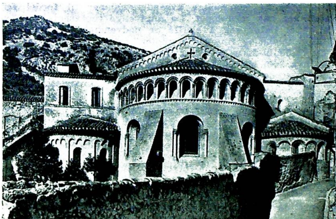
Klosterkirken St. Guilhem-le-Désert ligger inneklemt mellom steile, forrevne fjellsider i Herault-dalen i Languedoc.

Når pilegrimene var nådd så langt vest som til Toulouse, samlet de seg i St. Sernin, Syd-Frankrikes største og skjønneste romanske kirkebygg, og det rikeste på relikvier. Kirken ble påbegynt ca. 1060 og fullført i midten av det 12. århundre. Til å være romansk, er den ualminnelig stor, bare litt mindre enn Nôtre-Dame i Paris. Den er bygget med det mål for øye å romme enorme skarer av pilegrimer og å gi ceremoniene den størst mulige festivitas. Derfor har det imponerende skip 2 sideskip på hver side, samt gallerier. Det samme har transeptet. I koret er der både kapeller og koromgang til prosesjoner, og kirken har hele 8 innganger, hvorav den såkalte «Porte Miégevillie» er berømt for sine skulpturer, som kom til å danne skole i Syd-Frankrike. De viser både større uttrykksfullhet og friere bevegelser enn samtidige skulpturer fra det 12. århundre.