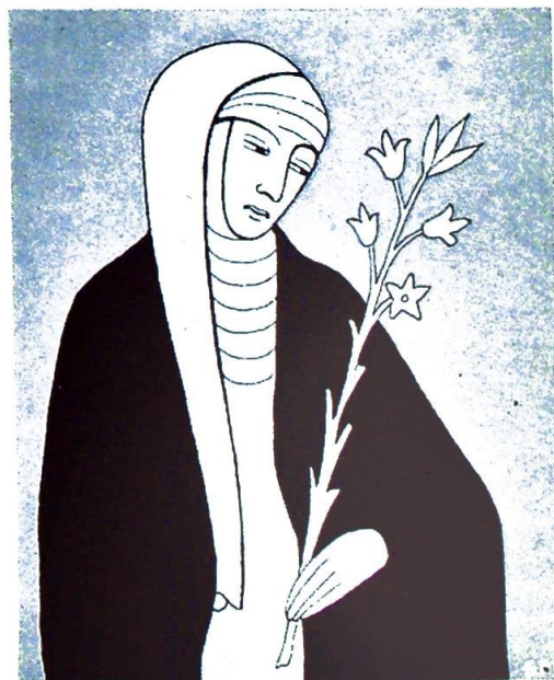
Caterina av Siena.

I Caterinas brev til den forfinede, men en smule veke pave Gregor XI ser man hvor hel og sterk og krevende hennes kjærlighet er. Med underfull menneskekunnskap har hun sett til bunns i pavenes sjel og forteller ham at et menneske som er falt for selvkjærlighet, blir likegyldig med sine underordnedes feil og synder fordi han er redd for å støte dem og gjøre dem til sine fiender. Den art skånsomhet som beror på at en ønsker å hegne om seg og sitt, forleder en til å smøre salve på sår for å behage pasienten, mens det er åpenbart at såret først må renses i smerte før salven blir ufarlig, og før den kan ha legende virkning. Caterinas tale er åpen, direkte, og ville virket anmassende dersom den ikke bar så tydelig preg av omsorg for paven og kirkens åndelige ve og vel. Det var denne paven som — delvis under hennes innflytelse — bestemte seg for å flytte fra Avignon til Roma og som