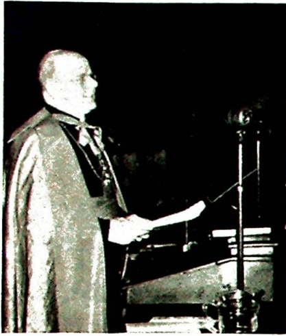
Kardinal Griffin taler i Albert Hal.

Erkebiskopen av Westminster slo et kraftig slag for de forfulgte kristne bak jernteppet i et hyrdebrev som han sendte ut til Trefoldighetssøndag;