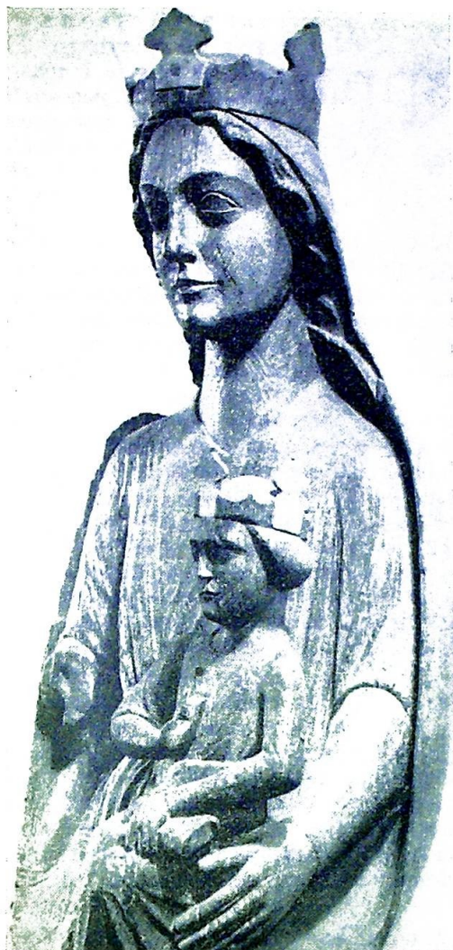
«Vår Frue av Norge». Fra Enebak kirke.

I den Katolske Kirke inntar helgendyrkelse og Maria-kultus på ingen måte noen dominerende plass, slik «at det hele nærmer seg avgudsdyrkelse», altså: på bekostning av Gud selv. Tvert imot: det trenges slett ingen dyptgående viten om Kirken for å forstå at hele dens åndelige struktur, ja, hele dens religiøse liv i det hele tatt med intens styrke konsentrerer seg omkring Guds Sønn Jesus Kristus. Alt i Kirken går ut fra og tilbake til Jesus Kristus som den absolutt sentrale skikkelse: hele Kirkens liturgi, det daglige messeoffer, sakramentene, andakten og forkynnelsen.