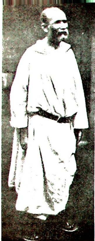
Eneboeren Charles de Foucauld