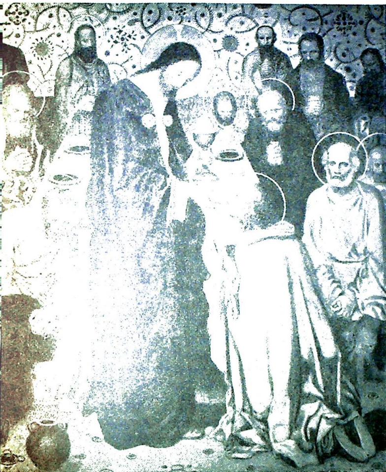
Hoc est corpus meum... Dette er mitt legeme.

skrift (Hebr. 5, 1—2.) Et mandat uhyre i sin rekkevidde! Fra vigslens morgen skal dere bære fram Det hellige messeoffer i bevisstheten om at korsdøden på Golgata ikke var en engangshendelse, men at Jesus Kristus fra Nazareth ennå vandrer omkring på jorden med sitt kors, ofrer og ofrer seg på ny. Dere skal ha nøklene til hans grav i tabernaklet og skal måtte rekke fram hans legeme til verdig og uverdlig. Dere skal omgås hellige og syndere og være en far for dem alle, lytte, tilgi og råde — opplyst av Den hellige ånd. Dere skal være lærere for stolte og ydmyke, være lege for syke og urolige, men også leder for søkende og hengivende sjeler, — øse av kjærlighetens visdom og balsam. Dere skal være dommere, skille klart mellom godt og ondt, mellom synd og synd, — grenseløst medlidende. Dere skal være sjelenes røkter fra vuggen til graven, hele livet være knyttet til dem gjennom nåden fra Kristus. Med ham skal dere sammen med dem gå ut om morgenen, og med dem vende tilbake sammen med ham om aftenen.