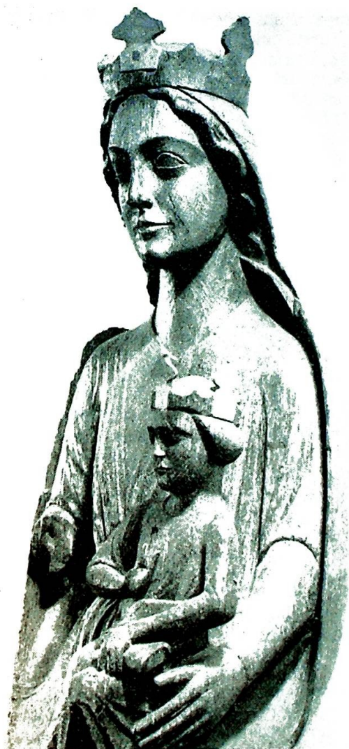
Maria med Barnet. «Vår Frue av Norge». Fra Enebak kirke.