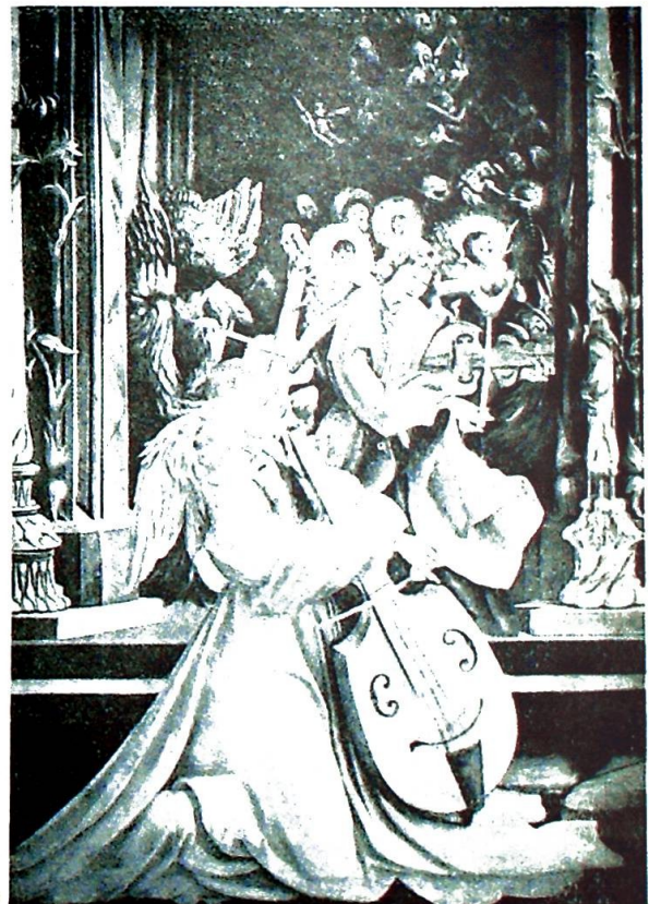
Mathias Grünewald: Engler.

Vi vil altså ikke fornekte Guds gaver, men stille den inn i en sammenheng som gir den evighetsverdi. Vi vil ikke jage etter kunst-opplevelser for den tilfredsstillelse de gir oss i øyeblikket, men vi vil ta kunsten i vår tjeneste p. g. a. den evne den har til å få oss til å lytte og til å åpne oss mot den store virkelighet som ligger bakom. Det er også vår oppgave når vi synger og spiller i Kirken. Gjør vi det med den rette kjærlighet, burde resultatet bli større kjærlighet, både i oss selv og i andre. At det er en stor og vanskelig oppgave behøver jeg visst ikke si. Hvor