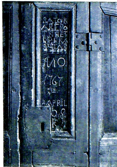
Detalj av Inderøy-skapet.

Disse to menn, Cepicka og Husak, er det som er blitt gitt det oppdrag «å forsvare det tsjekkosllovakiske folks frihet og det tsjekkosllovakiske presteskap». De er utpekt til dette fordi de har lagt for dagen en sjelden evne til brutalitet. Valget viser at politi-byrået i Praha ikke vil rygge tilbake for å bruke noe middel i sin kamp mot katolikkeen i Tsjekkosllovakia som nå kjenner disse «forsvarere av troen».