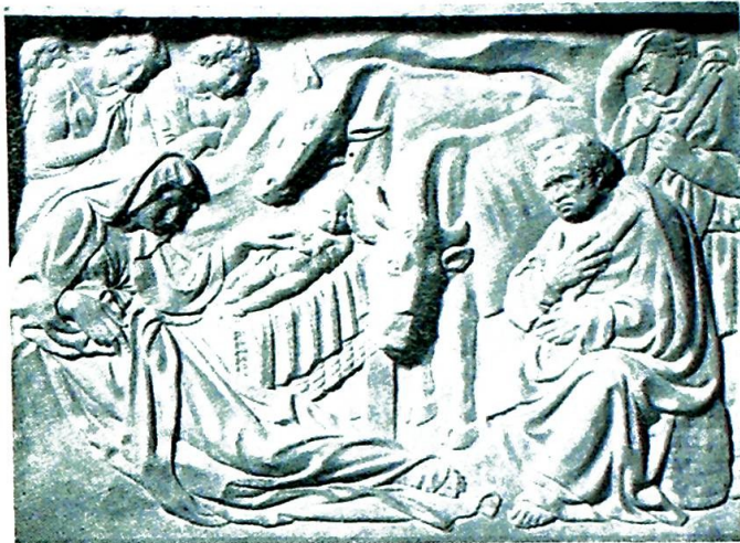
«Fødselen», etter en skulptur av Jacopo della Quercia. (St. Petronius-kirke, Bologna.)

— De må la oss slippe inn! Den unge kvinnen lente seg