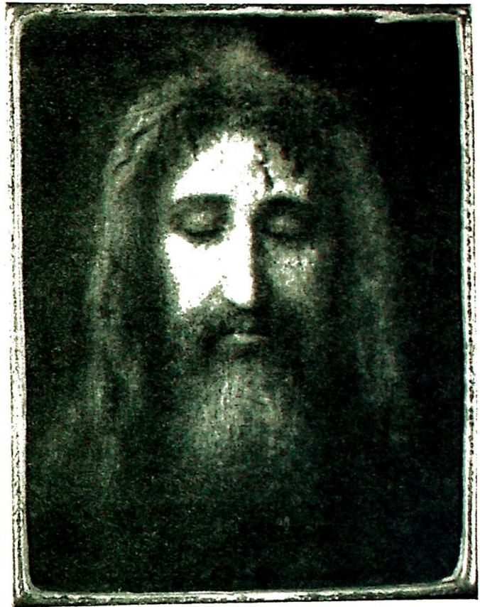
Det Hellige Ansikt. Etter Le St. Suaire de Turin.

og da Han sa: «det er meg», vek de tilbake og falt til jorden.