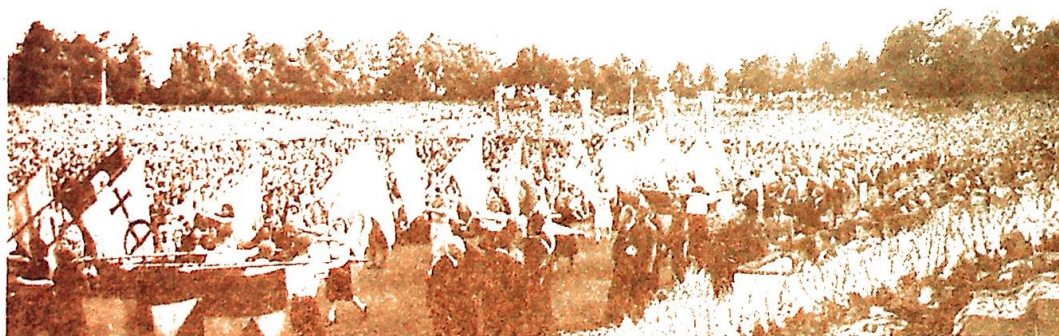
Over 100 000 mennesker fylte Stadion på den store manifestasjonen på jubileumsdagen 15. aug. Samtlige kardinaler, unntatt kard. von Faulhaber, framførte sine lands hilsener til de tyske katolikker.