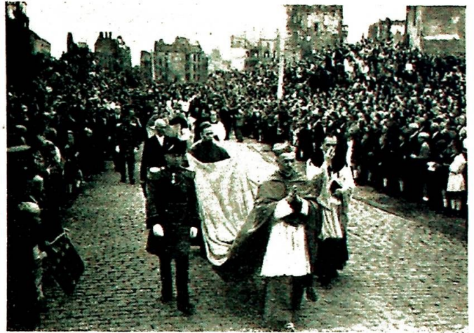
En tre kilometerlang prosesjonsrute, hvorav siste del til fots, var omringet av uoversiktelige menneskemengder mellom og på ruinene. Her sees Kölns erkebiskop, kard. Frings, iført Cappa magna nærme seg Domen. Fin og elskelig i sitt vesen, — en av Kirkens betydeligste personligheter i dag. I hans følge sees fyrst Metternich (i sivil t. v.).