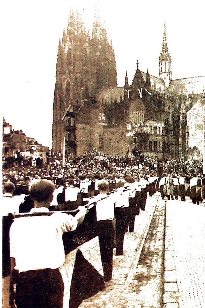
Kolpingsöhne med sine bannere i prosesjonen.

Tyskernes Kölnerdom og engelskmennenes St. Paul's Cathedral er to navn fra kunst- og kulturhistorien som vesterlandene i århundrer har regnet blant sine store vidundere. I fredelige tider minte de oss om hva et folk kan yte av stort og vakkert når indre enhet og ytre likevekt preger nasjonene. I krigerske tider sto de som åndens jetter og manet sine mestres ødslende arvinger til besinnelse. Vi av denne generasjon bærer dette siste bildet av dem redusert til dunkle konturer bak skyer av hvirvlende ild, røk og støv. I dag raker de opp av ruinmarker som uvirkelige giganter i et hulter til bulter av menneskelig menigsløshet. Regnestykket om menneskets storhet i forhold til dets dårskap er ikke lett å løse!