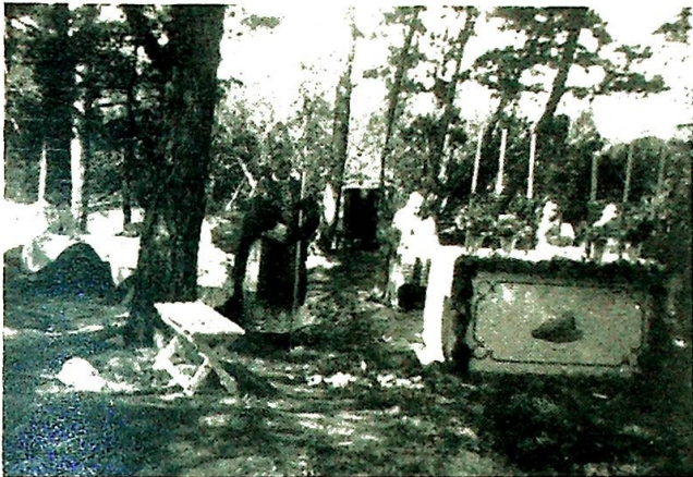
Biskopen taler ved pontifikalmessen på Stella Maris.