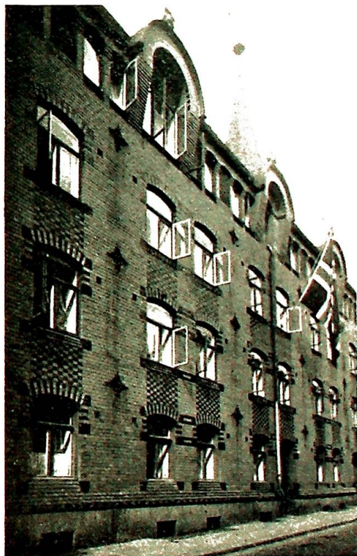
St. Josefs Hospital mot gårdsplassen.