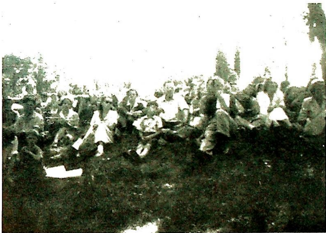
Den lyttende menighet.