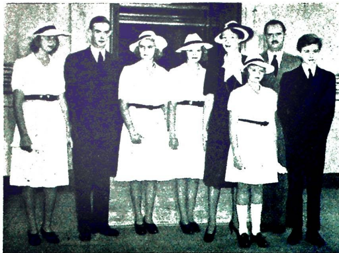
Den storhertugelige familie.

produksjon, men etterspørselen er hektisk, prisene høye — og landet er i stand til å skaffe kull og koks importert ikke bare til høyovnene, men også til hjemmene.