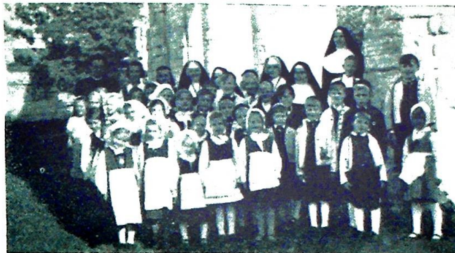
Barn fra St. Sunnivaskolen, Oslo, på besøk hos søstrene på Hamar.

Protokoll og regnskap ble enstemmig vedtatt uten debatt. Deretter gikk man over til valg som fikk følgende utfall: