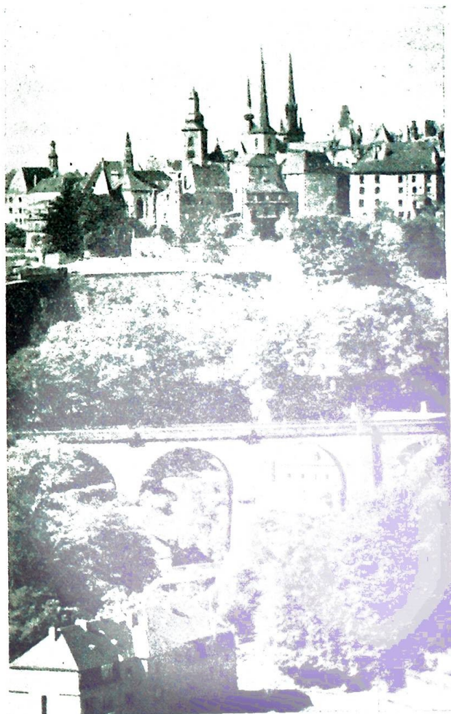
Hovedstaden Luxembourg med katedralen.

Det er med sorg at en forlater dette lille paradiset på jorden.