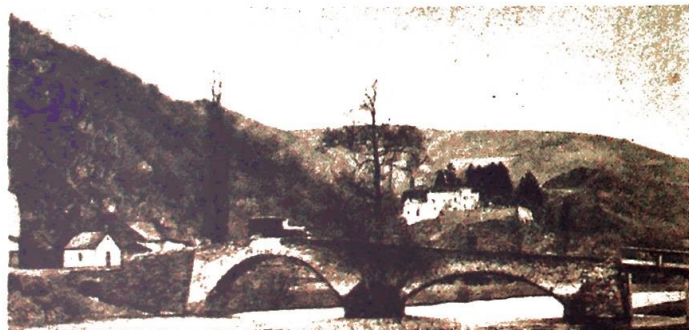
Stolzembourg i Luxembourg. (Biskopens hjemsted.)

Hemmeligheten ligger i den uhyre rikdom på malm. Før krigen var en oppe i en årlig produksjon av 4 millioner tons jernmalm, 2 millioner tons støpejern og 2 millioner tons stål. Ennå mestrer en bare ca. 65 % av denne