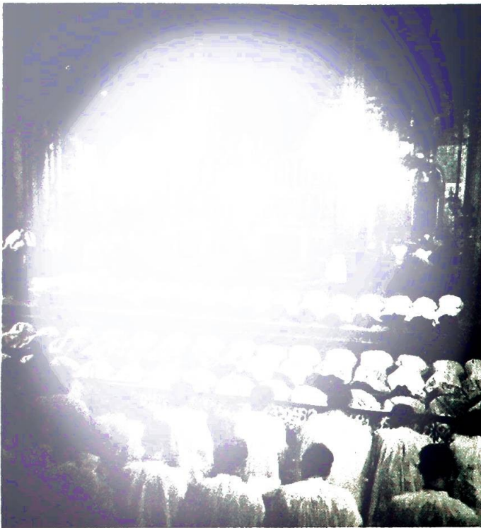
Mens allehelgenslitaniene synges ligger de 58 nye misjonsprester utstrakt foran høyalteret (L'Eglise des Etrangers, Paris).