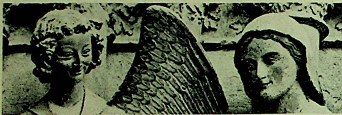
«Bebudelsen»-gruppe i sten på katedralen. Også kallt «Smilet fra Reims».

Katedralen i Reims, et av den kristne middelalders mesterverker, de franske kongers kroningskirke, er gjenreist av sine ruiner og blev høytidelig innviet søndag 10. juli. Dens berømmelse skyldes imidlertid ikke alene dens kunstneriske og historiske betydning — gjennom sitt martyrium er den blitt et samlingens tegn for hele den freidselskende kristenhet.