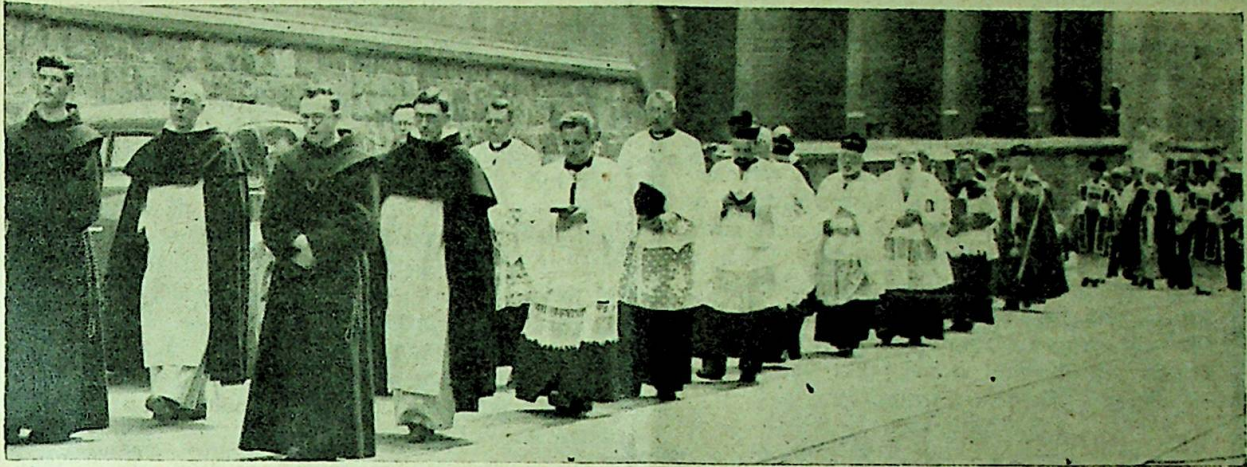
Prestene og biskopen i sørgeskaren.

St. Olavs-kirkens port har for siste gang lukket sig bak ham da vi i høitidelig prosesjon førte ham til graven, men om noen dager åpner de sig for en annen prosesjon: da fører vi Kristi hellige legem ut i hverdagslivet fra dets fredfylte Tabernakel på vårt alter. Vi fører det ut for jublende å vise allverden, hvilken skatt vår hellige Kirke eier i sin tro på den alltid levende Frelsers nærvær, og for å gi den andel i denne skatt gjennom velsignelsens tegn. Kan det tenkes herligere vidnesbyrd om troens kraft enn det vi katoликer her i Oslo i år får lov til å avlegge? Man har sett en procesjon i sorg, nu får man se den umiddelbart efter i glede, fordi dødens beseirer bor i vå-