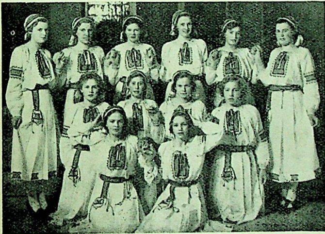
St. Theresiaforeningen, Hamar.

Under denne overskrift leser vi i «Hamar Stiftstidende» for 30/4 følgende referat: