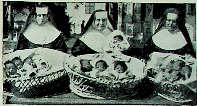
«Hvad I gjør mot disse mine små —»

ker mot den usynlige. Og når jesuittene idag i Zikawei har en berømt værvarslingsstasjon, som har frelst utallige skib fra de ødeleggende taifuner, så er det kun en fortsettelse av gamle tradisjoner.