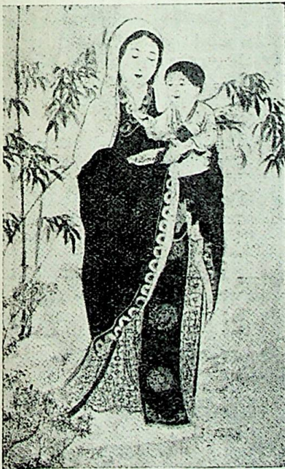
Maria med barnet, sett med kinesiske øiner.