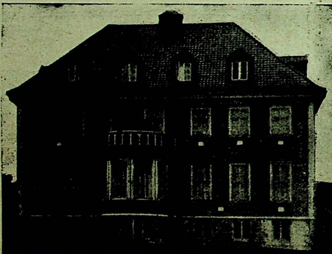
St. Franciskus-hospitalet, Haugesund.

Reisehåndboken opplyser at Haugesund «ligger ut mot havet, men i ly av noen småøier og den nordligste odden fra Karmøy. Et åpent landskap av enkle linjer og få farver omgir byen fra landsiden, sammensatt av grønne jorder, skogplantninger, lave knauser og brungrå åsrygger».